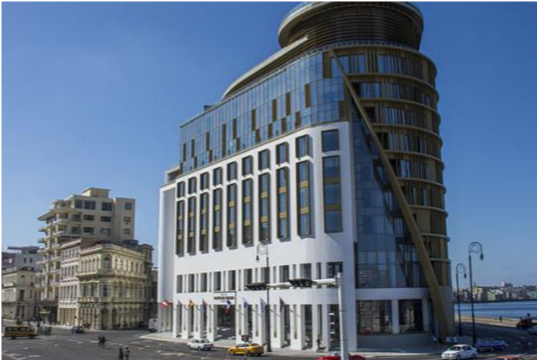
Hotel Royalton Habana Paseo del Prado.