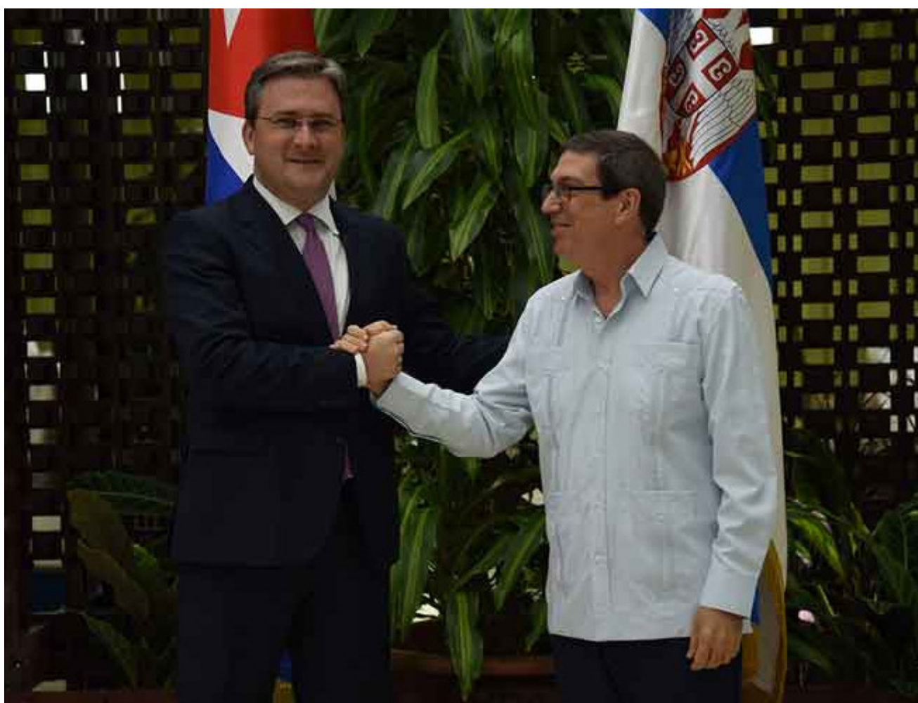
Ministres des affaires étrangères-Cuba-Serbie-

La Havane, 4 août (RHC) Le ministre des Affaires étrangères de Cuba, Bruno Rodriguez, a reçu aujourd'hui son homologue serbe, Nikola Selakovi?.