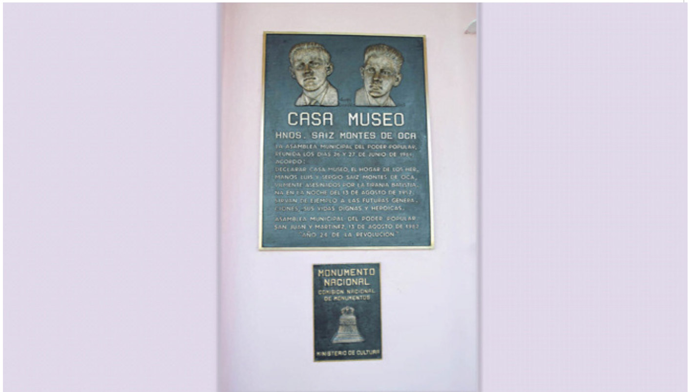
Casa Museo Hermanos Saíz