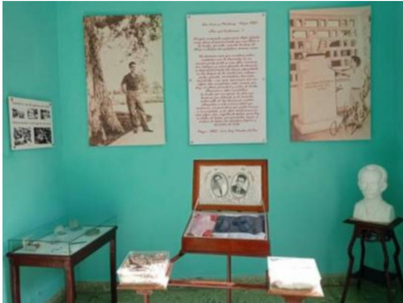
Casa Museo Hermanos Saíz