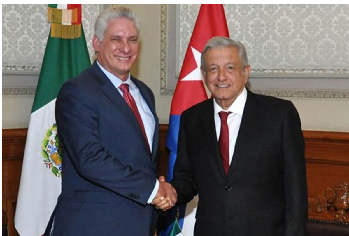
Díaz-Canel (I) y López Obrador ratifican los históricos lazos de amistad de sus pueblos y Gobiernos.

La Habana, 17 ago (RHC) El primer secretario del Comité Central del Partido Comunista de Cuba y presidente de la República, Miguel Díaz-Canel agradeció este miércoles al mandatario de México, Andrés Manuel López Obrador, por la oportuna, eficaz y necesaria ayuda brindada ante el incendio en la Base de Supertanqueros de Matanzas.