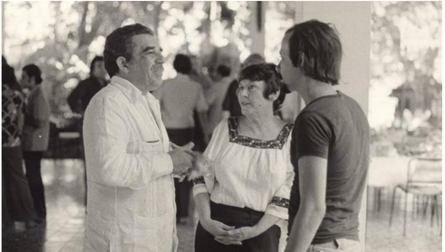
García Márquez, Silvio Rodríguez y Aidee Santamaría

contemple, pudo romper sus cadenas, pudo su yugo romper. También lo puede un cubano, la unión no puede perder”.