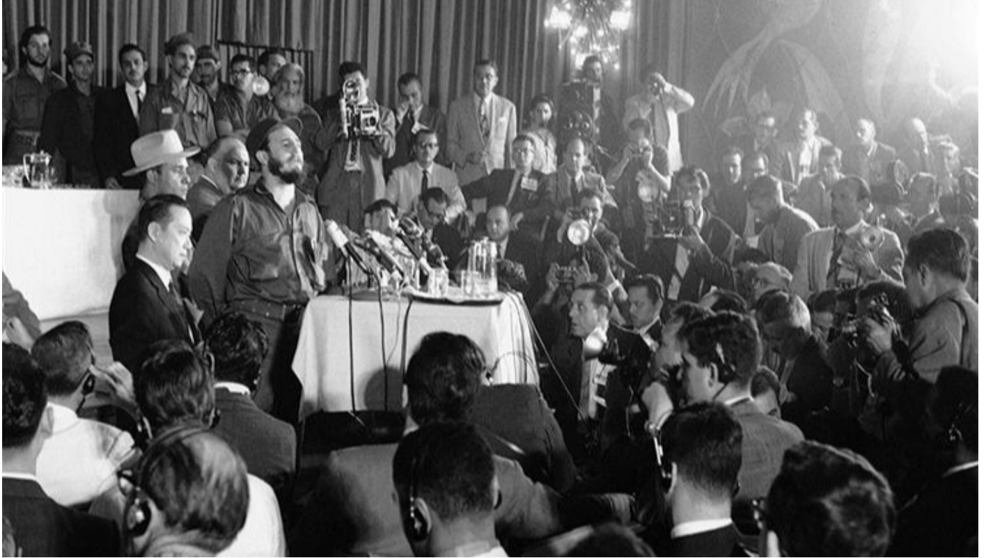
Fidel Castro, fundación de la Agencia Prensa Latina

“Guillén nos pintó un panorama de la Cuba de aquellos tiempos...Se levantaba bien temprano, como en Camagüey, abría la ventana y gritaba las últimas noticias en Cuba y en toda América Latina. En una de esas ocasiones, el 1 de enero de 1959 gritó una noticia única: “!Se cayó el hombre!”, el hombre era el entonces presidente Fulgencio Batista”.