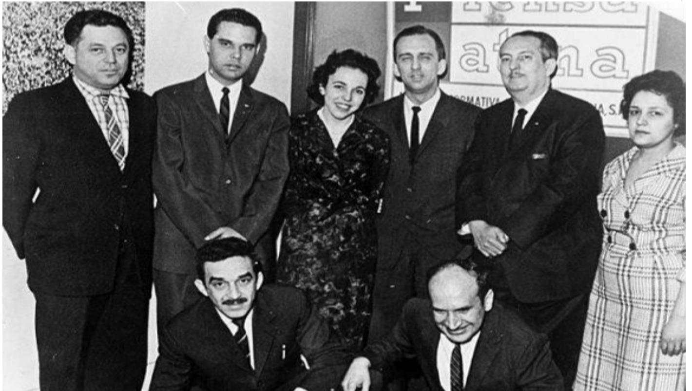
Gabriel García Márquez