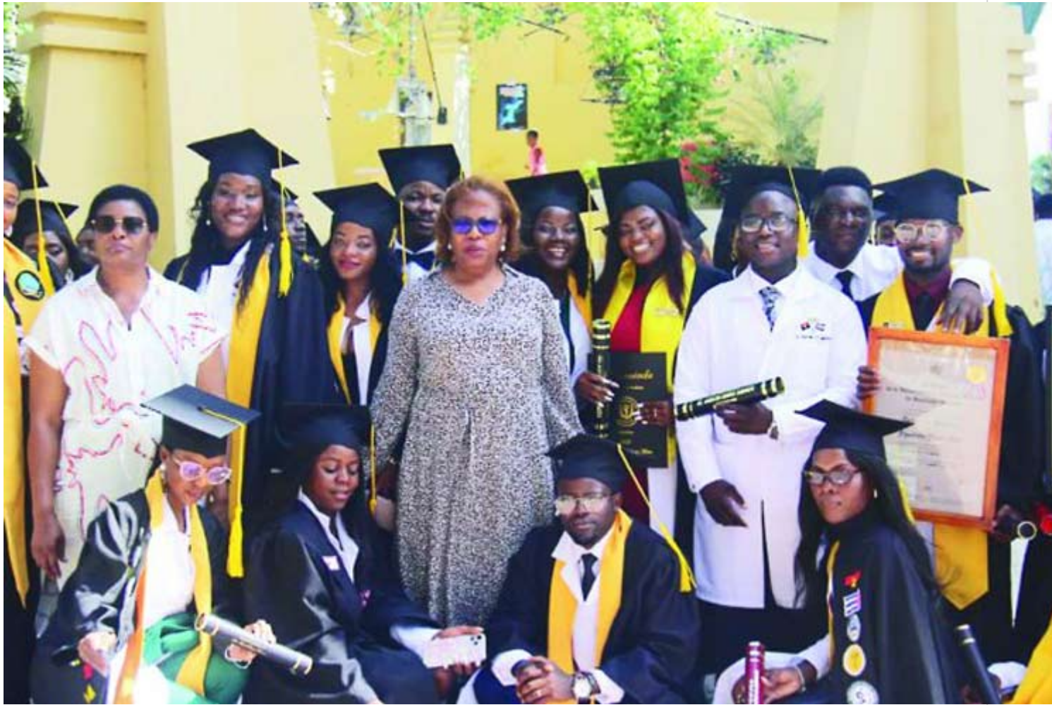
Angola recibe a médicos formados en Cuba.

Luanda, 21 ago (RHC) Angola recibió este domingo a más de 200 jóvenes profesionales de la salud formados en Cuba, con la expectativa de colocar sus conocimientos al servicio del pueblo.