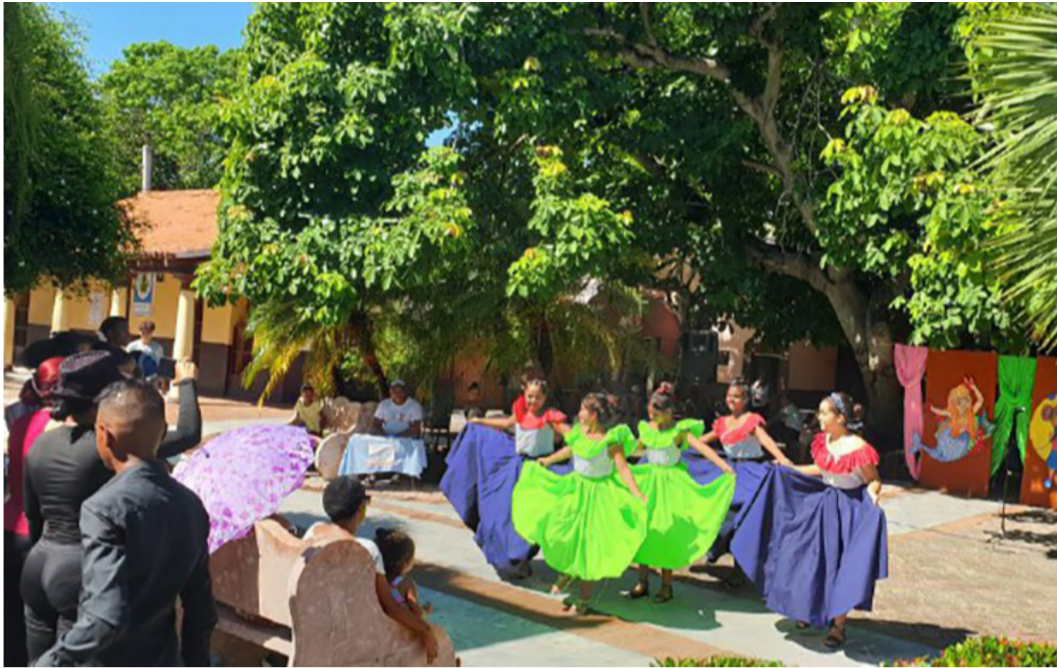
Celebran escénicos XX edición de Teasur en Isla de la Juventud

Nueva Gerona, 24 ago (RHC) Los artistas escénicos de Isla de la Juventud celebran hasta el próximo 27 de agosto la XX edición de Teatro al Sur (Teasur), cita estival con carácter anual de cara a las comunidades menos favorecidas con instituciones culturales.