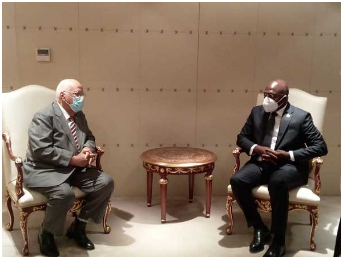
El viceprimer ministro de Cuba Ricardo Cabrisas.

Luanda, 26 ago (RHC) El viceprimer ministro de Cuba, Ricardo Cabrisas, llegó este viernes a Luanda para asistir a las ceremonias fúnebres del expresidente de Angola José Eduardo dos Santos.