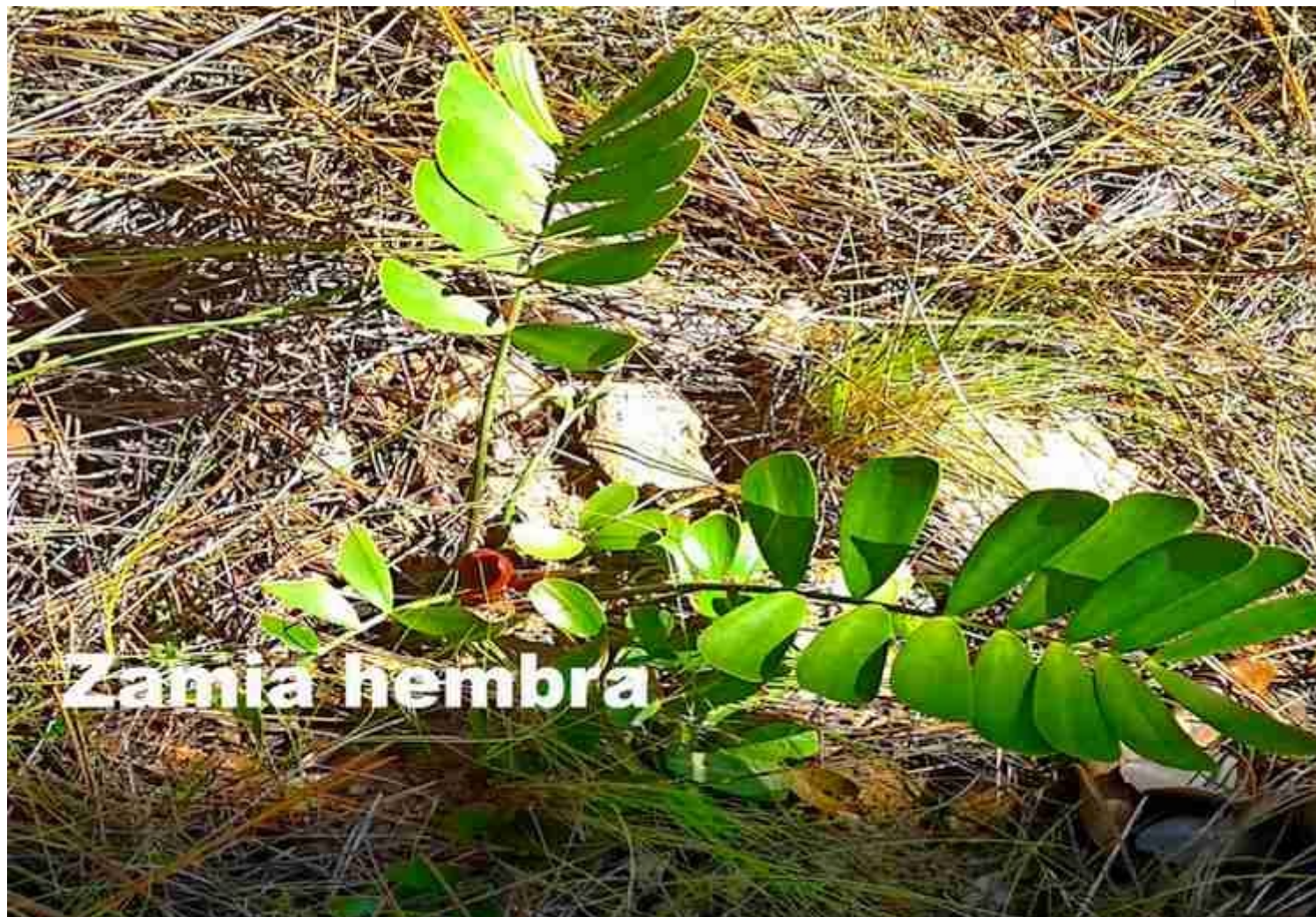
Zamia pygmaea –especie endémica del occidente cubano.

Nueva Gerona, 29 ago (RHC) La Zamia pygmaea , especie endémica del occidente cubano casi amenazada de extinción, crece en dos de las áreas protegidas con diferentes categorías de manejo bajo la jurisdicción de la empresa de Flora y Fauna del municipio especial de la Isla de la Juventud.