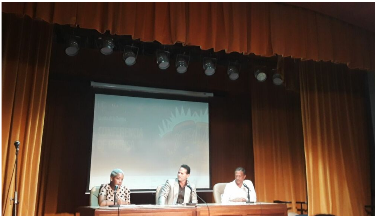
Regresa Festival Internacional Timbalaye tras la ruta de la rumba.

La Habana, 30 ago (RHC) La edición número 14 del Festival Internacional Timbalaye La ruta de la rumba comenzará este miércoles desdicado a la presencia yoruba en la rumba.