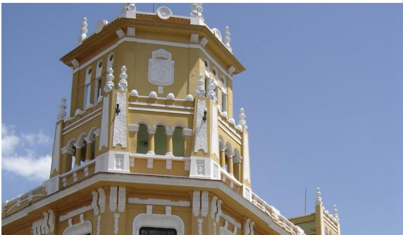
Joya arquitectónica, Patrimonio Sancti Spiritus.