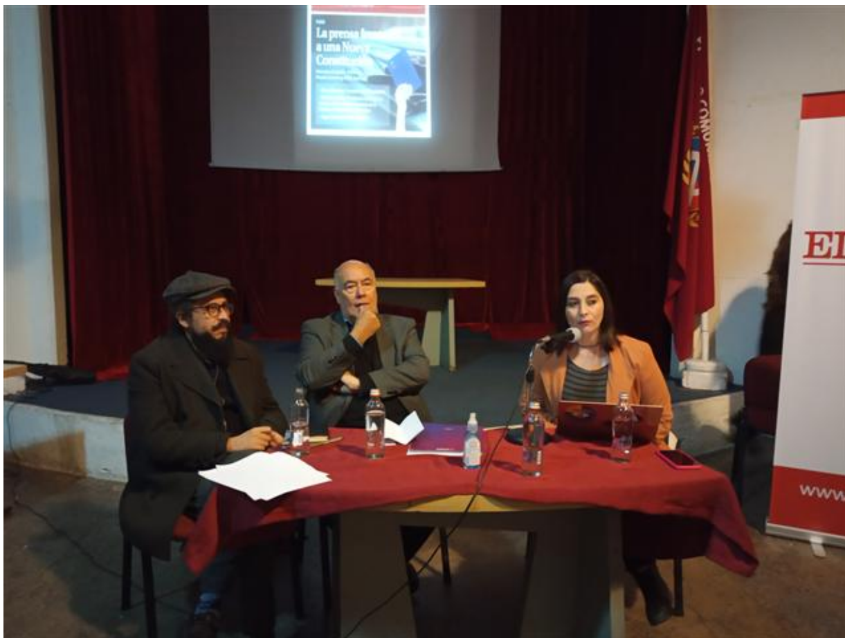
El nuevo proyecto de carta magna en Chile establece el derecho a la equidad comunicacional.

Santiago de Chile, 1 sep (RHC) El nuevo proyecto de carta magna en Chile establece el derecho a la equidad comunicacional, el pluralismo de los medios y la protección a los periodistas, destacaron varios panelistas.