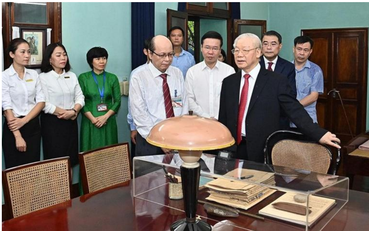
Máximos dirigentes de Vietnam honran memoria de Ho Chi Minh.

Hanoi, 1 sep (RHC) Los máximos dirigentes políticos y del Estado de Vietnam rindieron este jueves tributo de recordación al presidente Ho Chi Minh, en ocasión del 77 aniversario de la Revolución de Agosto y el Día Nacional (2 de septiembre).