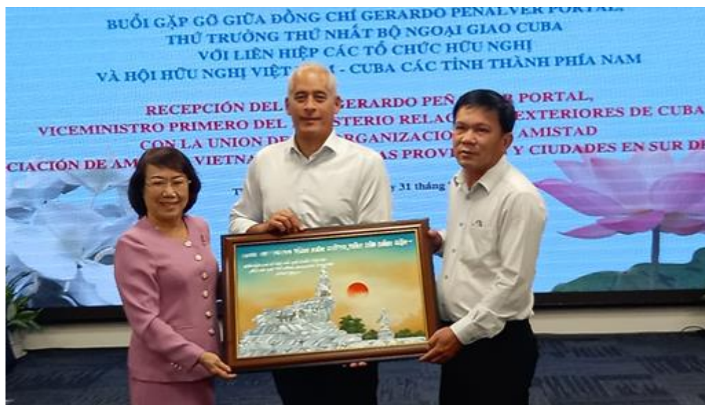
El viceministro primero de Relaciones Exteriores de Cuba, Gerardo Peñalver, llegará hoy a Cambodia.

Phnom Penh, 1 sep (RHC) El viceministro primero de Relaciones Exteriores de Cuba, Gerardo Peñalver, llegará este jueves a Phnom Penh para una visita de tres días a Cambodia, como parte de su segunda etapa de la gira de trabajo por naciones de Indochina.