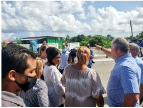
Photo : @PresidenciaCubaSur son compte Twitter, la présidence rapporte que dans cette communauté de 800 habitants, le président a souligné la nécessité de faire travailler les plus de 250 chômeurs et de tirer parti de toutes les zones cultivables pour produire des aliments.

M. Díaz-Canel a souligné que tout ce qui a été transformé dans cette zone doit être pris en charge, notamment la construction d'une épicerie, d'une boulangerie, d'une aire de jeux pour enfants et d'un terrain de sport.