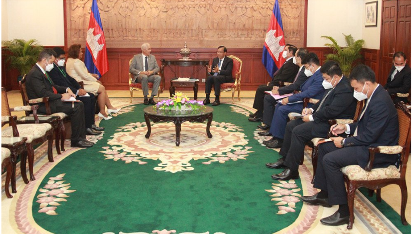
Reunión de Gerardo Peñalver con viceprimer ministro y canciller cambodiano, Prak Sokhonn

Durante su estancia de tres días aquí, el vicetitular del Ministerio de Relaciones Exteriores de Cuba fue recibido en visita de cortesía por el viceprimer ministro y canciller cambodiano, Prak Sokhonn, con quien abordó temas de la agenda bilateral e internacional y asuntos de interés común.