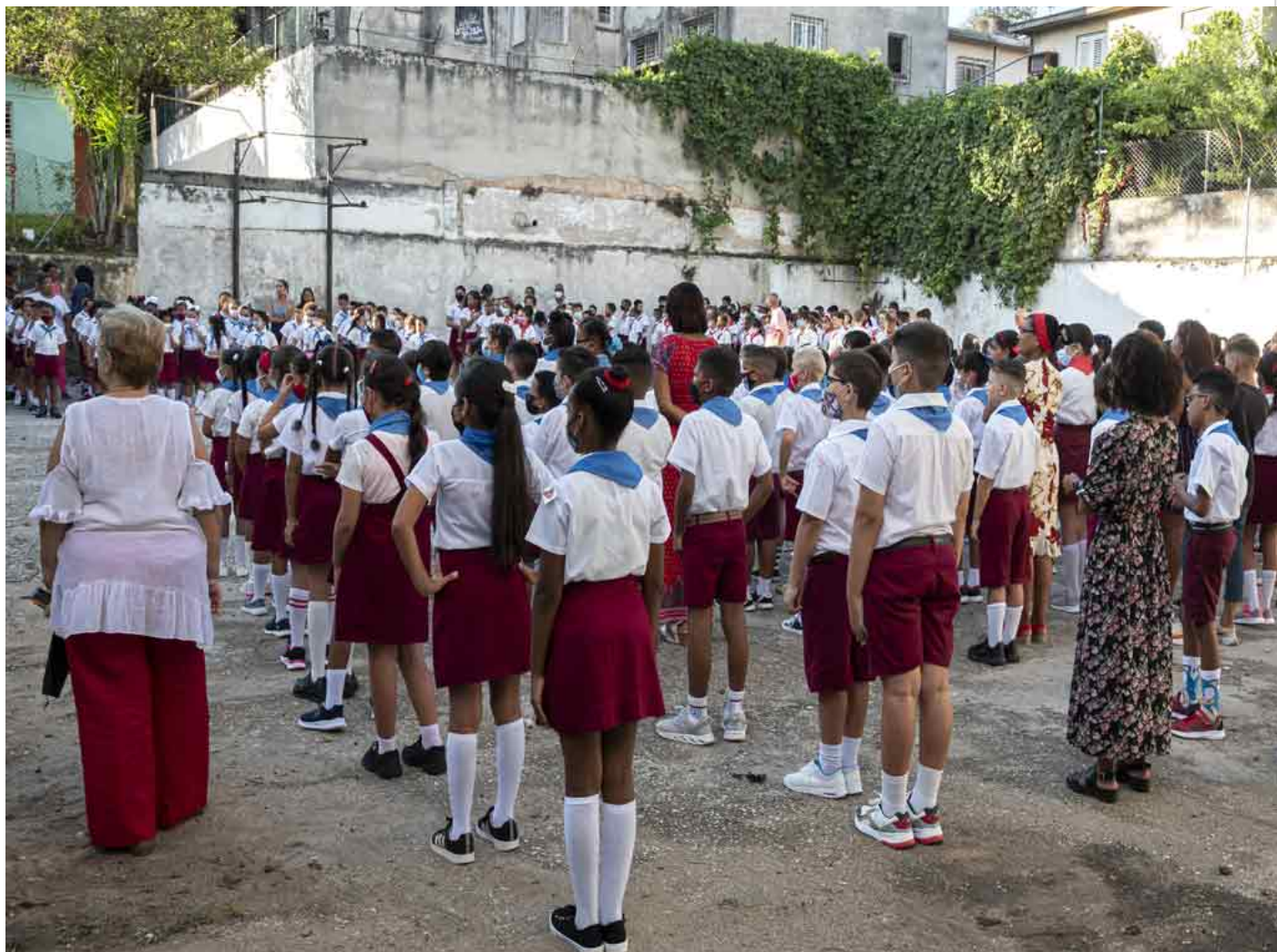
Provincia de Cuba reinicia sin contratiempos el curso escolar.

Camagüey, Cuba, 5 sep (RHC) Pese a las actuales circunstancias económicas y electroenergéticas, en la provincia de Camagüey se garantizó el reinicio del curso escolar para cerca de 115 mil estudiantes.