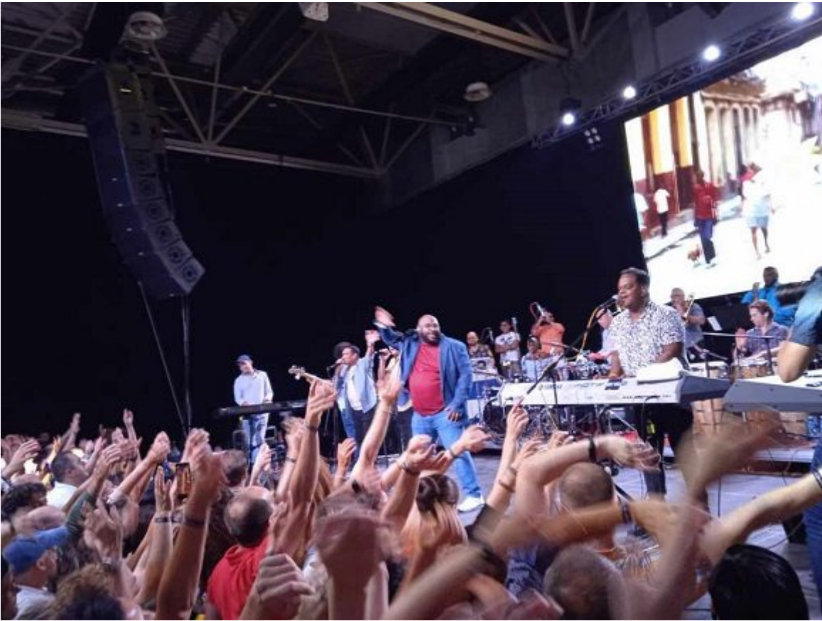
Havana D'Primera se presentó con éxito en Serbia.

Serbia recibió en junio pasado a la también orquesta Puppy y los que Son Son. El país es considerado uno de los principales escenarios de la música popular de la isla antillana en Europa.