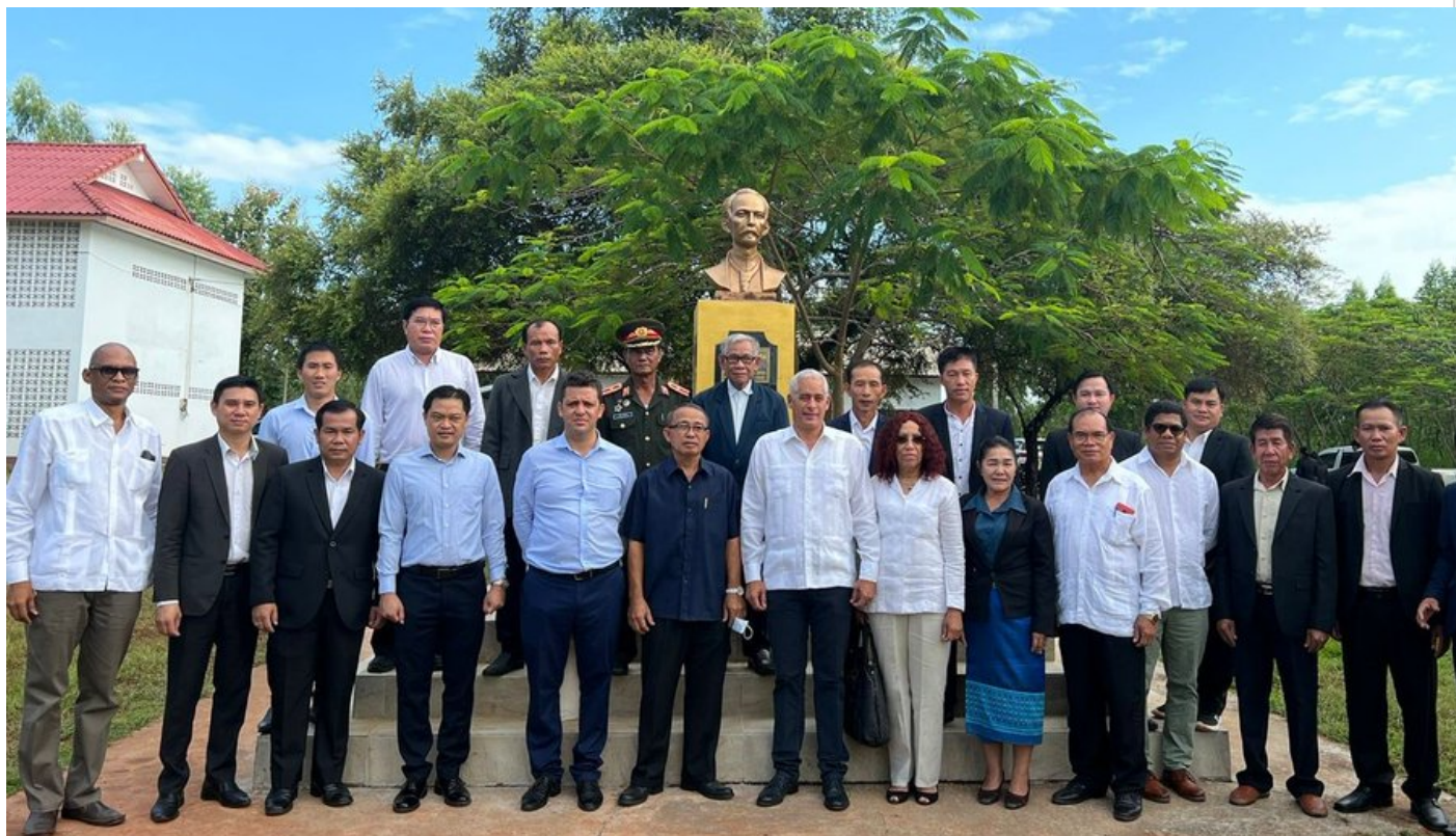
Peñalver rinde homenaje a Martí en escuela Amistad Cuba-Laos.

Vientiane, 6 sept (RHC) El viceministro primero de Relaciones Exteriores de Cuba, Gerardo Peñalver, concluye hoy una visita a Laos, última etapa de una gira por tres países de Indochina enfilada a reforzar las relaciones y fomentar la cooperación.