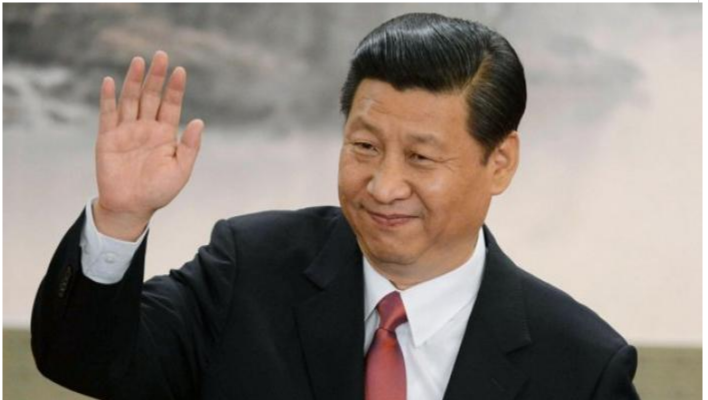
Prezidento Xi Jinping