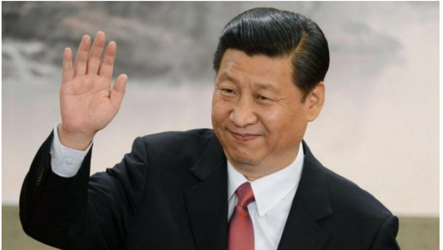
Prezidento Xi Jinping