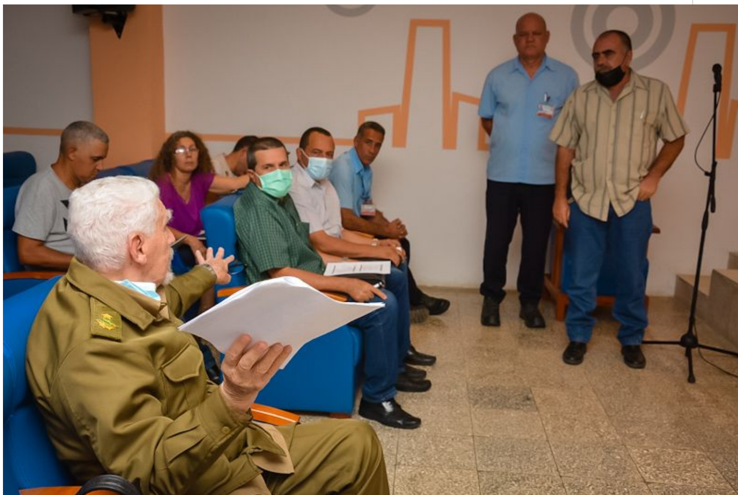
Ramiro Valdés comprueba acciones de la recuperación en Felton.