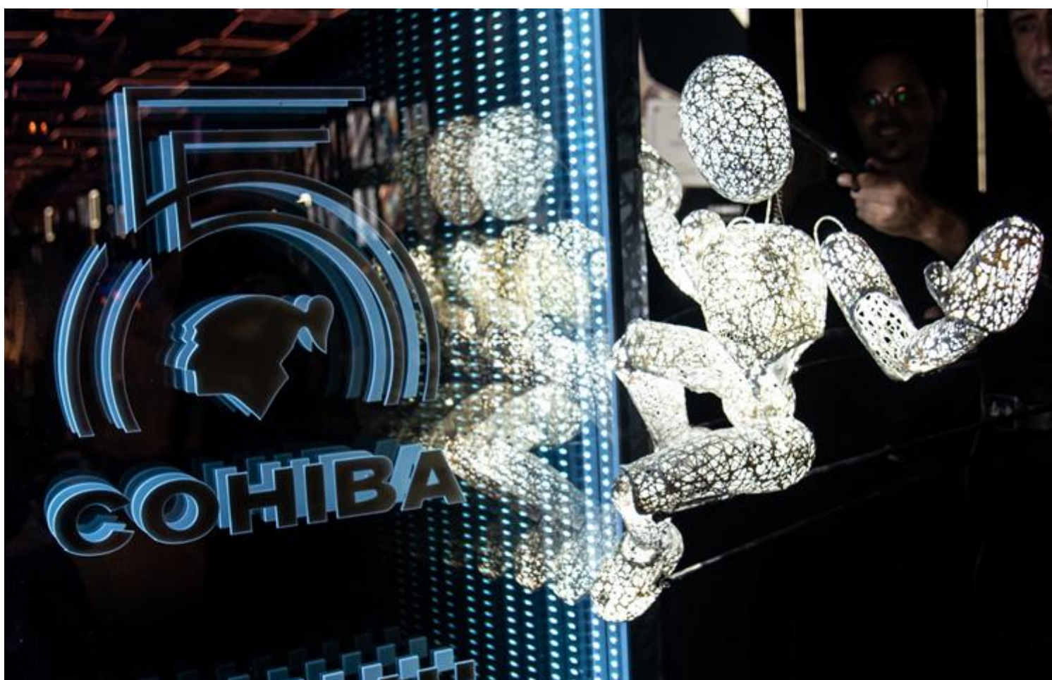
Cohiba contribuye a la Salud Pública de Cuba.

La Habana, 10 sep (RHCa) La subasta de dos humidores únicos, por el aniversario 55 de los tabacos Cohiba, recaudó 12 mil 800 euros, monto destinado a la salud pública de Cuba, se conoció en la clausura de los festejos.