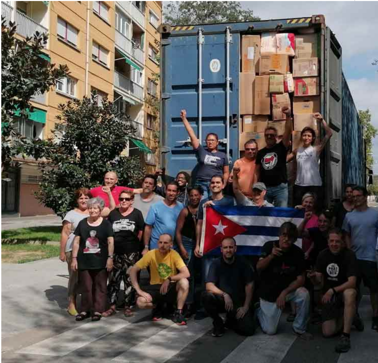
El cuarto contenedor de la campaña "Toneladas de Solidaridad contra el Bloqueo a Cuba", partió hacia la isla.

Madrid, 12 sep (RHC) El cuarto contenedor de la campaña "Toneladas de Solidaridad contra el Bloqueo a Cuba", partió hacia la nación caribeña desde Cataluña, según informaron sus organizadores.