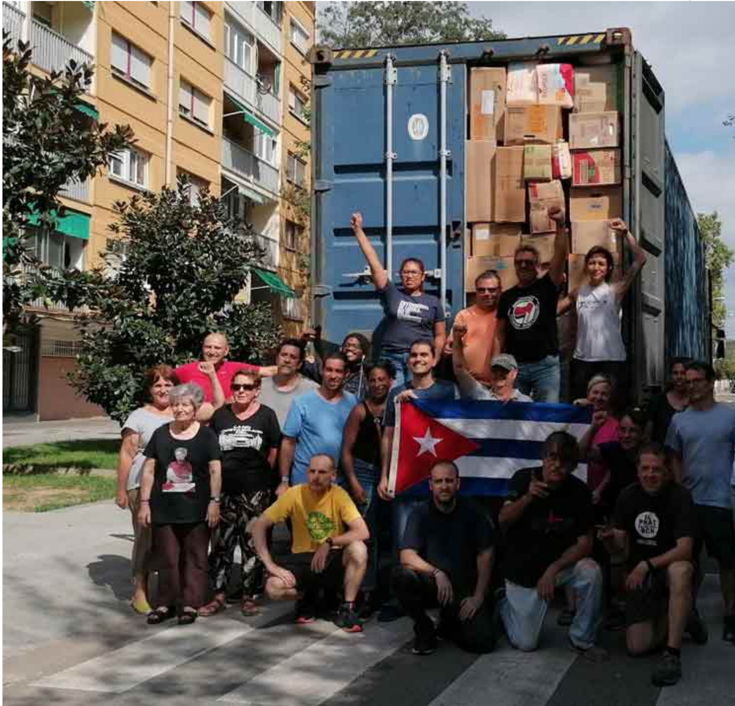
El cuarto contenedor de la campaña "Toneladas de Solidaridad contra el Bloqueo a Cuba", partió hacia la isla.

Madrid, 12 sep (RHC) El cuarto contenedor de la campaña "Toneladas de Solidaridad contra el Bloqueo a Cuba", partió hacia la nación caribeña desde Cataluña, según informaron sus organizadores.