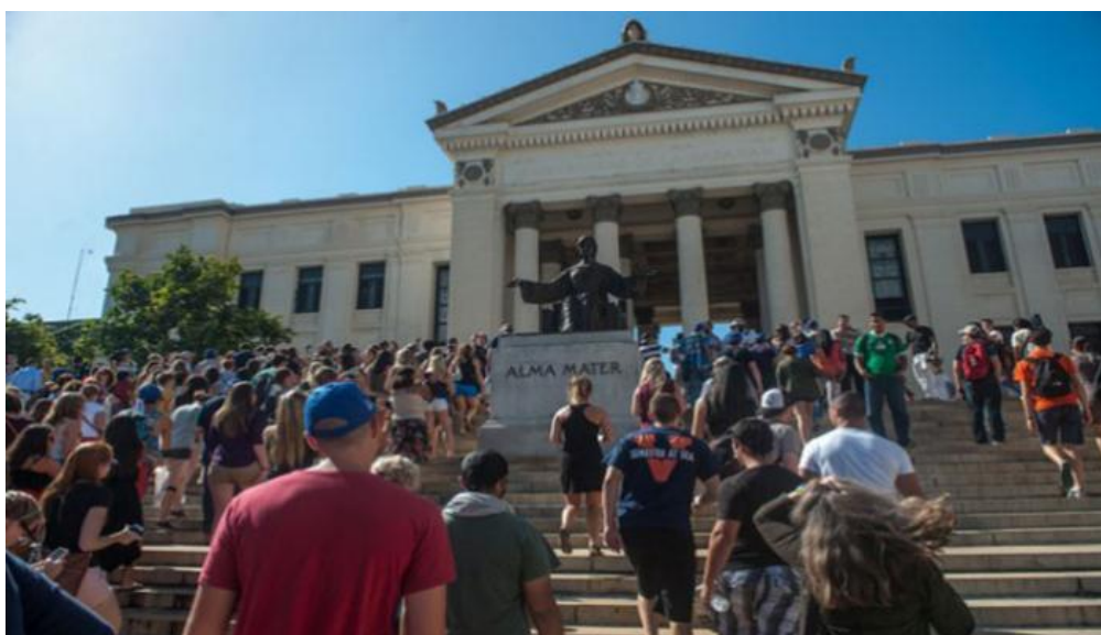
La UH es el centro universitario más antiguo de Cuba.