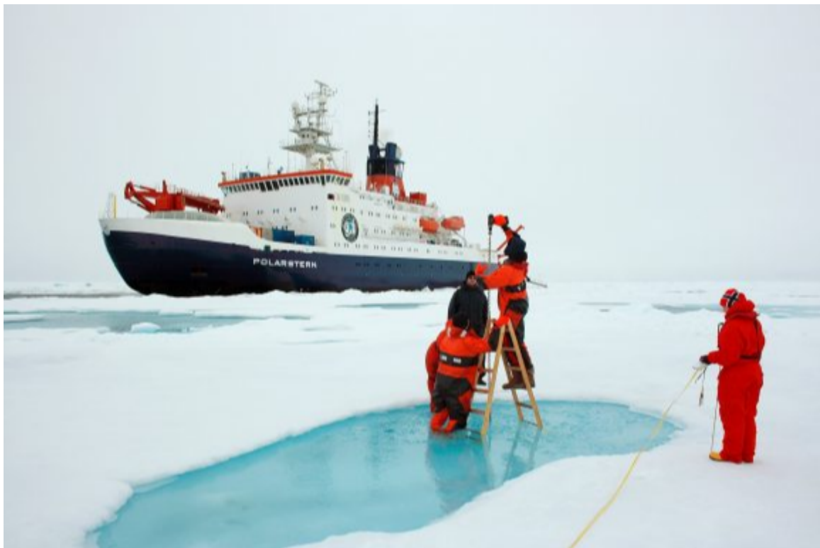
Exploraciones marinas en el Ártico.

A raíz del conflicto entre Rusia y Ucrania y la crisis energética en Europa, sale nuevamente a relucir un tema que se ha manejado con recelo durante algún tiempo entre los analistas de política internacional: una posible confrontación en (por) la región del Ártico; una zona que esconde valiosos recursos energéticos bajo sus heladas aguas y desde donde se miran frente a frente algunas de las naciones más poderosas del planeta.