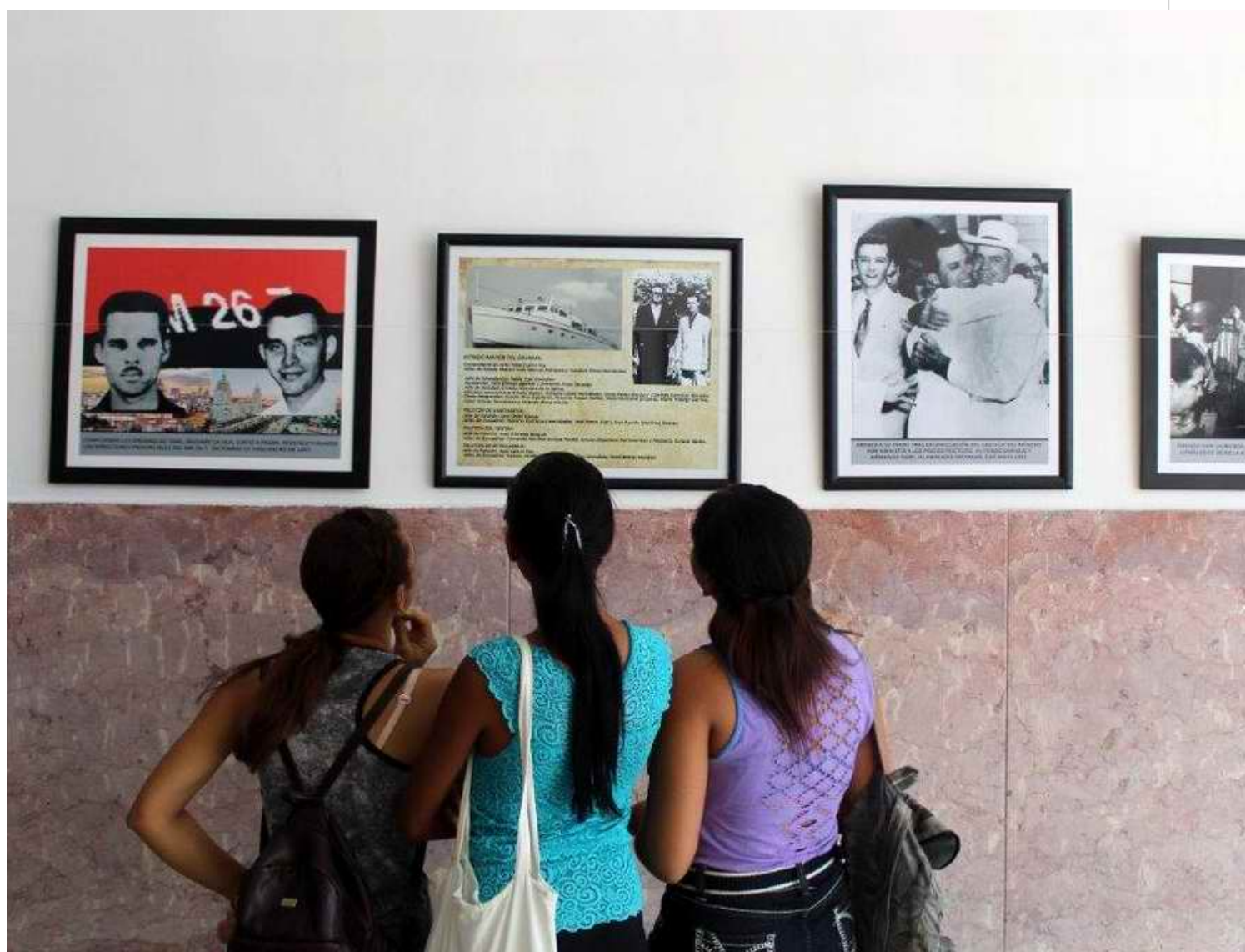
La muestra fotográfica Faustino, soldado de la Revolución, dedicada al inolvidable Comandante del Ejército Rebelde, Faustino Pérez Hernández.