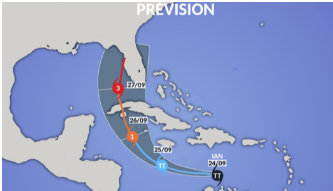
Prévision de la future trajectoire la tempête tropicale Ian | NASA

La tempête progresse désormais en direction du Nord-Est. Avec des vents à près de 75 km/h, et une pression minimale à 1003 hPa, le système est prévu de s'intensifier progressivement tout en remontant vers le Nord.