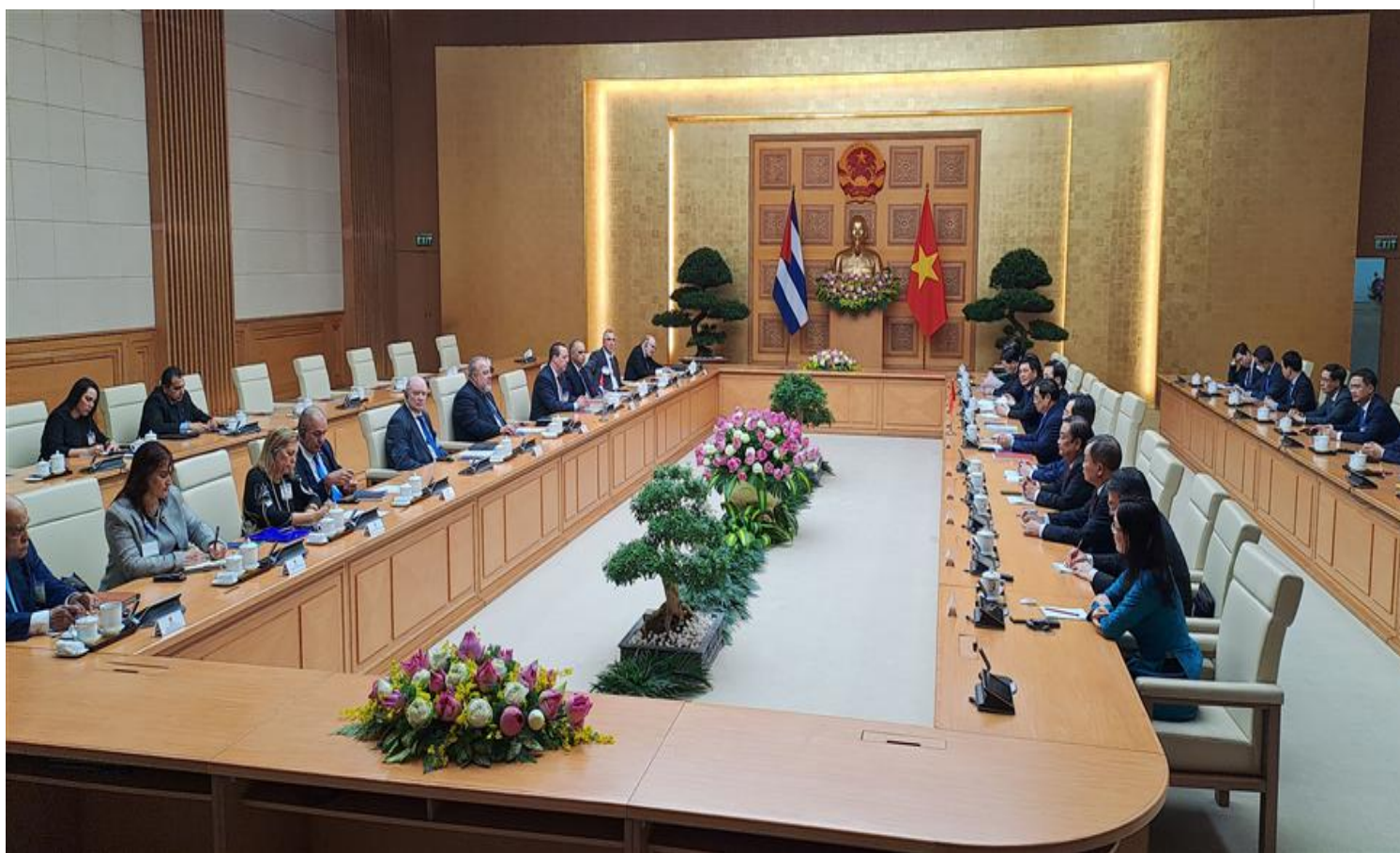
Conversaciones Cuba y Vietnam

Hanoi, 29 sept (RHC) Los gobiernos de Vietnam y Cuba representados por sus primeros ministros Pham Minh Chinh, y Manuel Marrero Cruz, suscribieron hoy aquí tres acuerdos enfilados a fortalecer y consolidar la cooperación en diversos campos y ensanchar las históricas relaciones de hermandad que unen a ambos países.