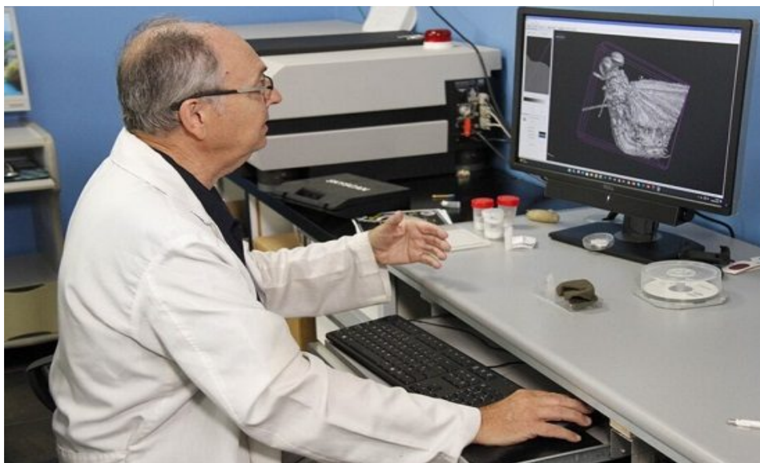
Científicos descubren insecto en una pieza de ámbar en el Báltico

Octubre 2- Un grupo de científicos europeos descubrió una especie de insecto en una pieza de ámbar del Báltico, con una antigüedad estimada entre 35 y 47 millones de años.