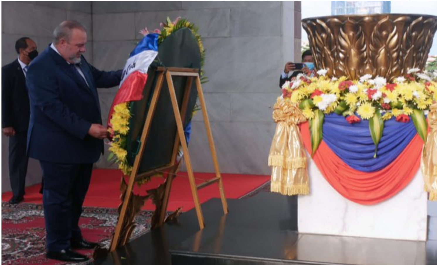
Marrero coloca ofrenda floral en el Monumento a la Independencia y el Monumento al rey Padre Norodom Sihanouk.

El jefe de Gobierno cubano, cumple hoy su segundo día de visita oficial aquí, con la cual finaliza una gira por la región de Indochina, es destacada hoy por medios como The Phnom Penh Post y The Khmer Times, que ilustran sus informaciones con fotos del encuentro entre Marrero Cruz y Hun Sen, y del visitante rindiendo honores en el Monumento a la Independencia.