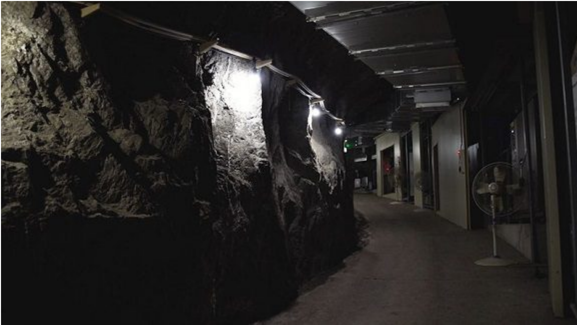
El laboratorio se inaugurará oficialmente en el 2023.

La mayor parte de la naturaleza esencial de los neutrinos sigue siendo desconocida, y los investigadores del IBS aseguran que la instalación subterránea les ayudará a detectar las señales de estos materiales poco conocidos sin interferencias de ruido de fondo o rayos procedentes del exterior.