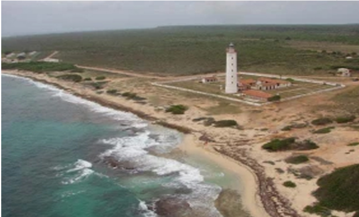
Punta de Maisí

Y finalmente, el extremo más al este de Cuba es la Punta de Maisí, en el municipio de Baracoa, primera ciudad fundada por los españoles en la isla, en 1511, perteneciente a la provincia de Guantánamo, la más oriental.