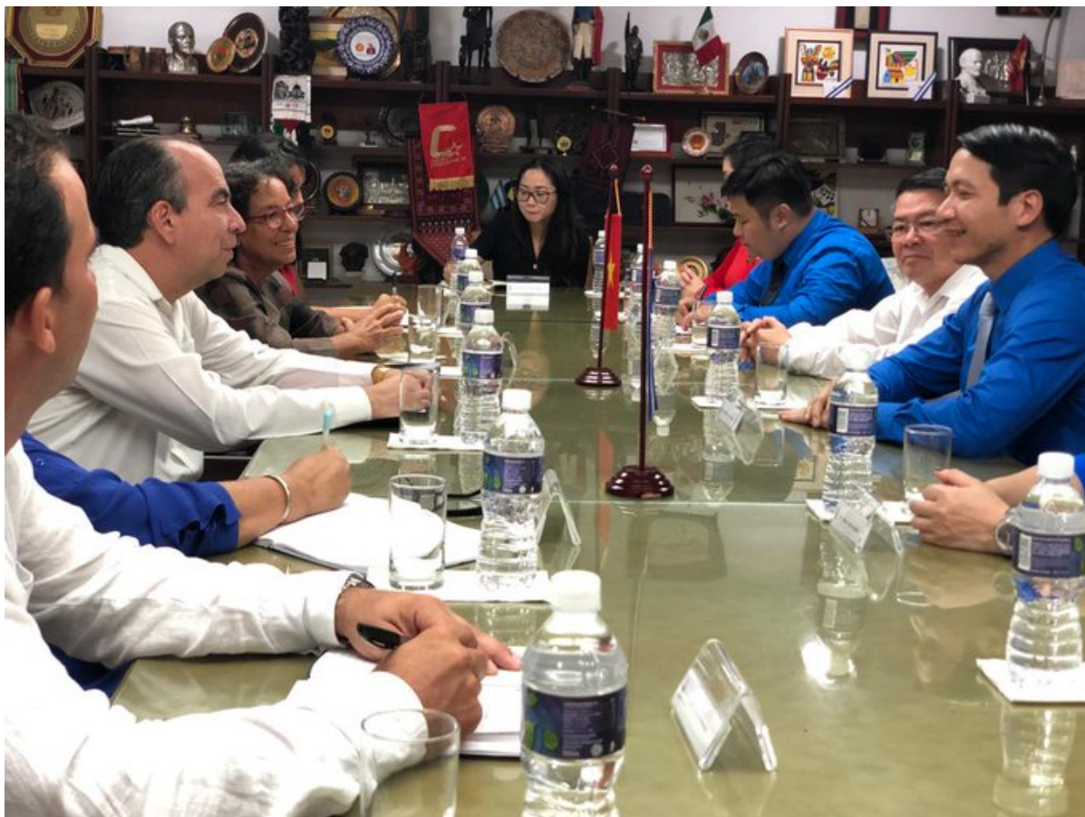
Ambas partes muestran interés en estrechar los vínculos que unen a los dos pueblos.