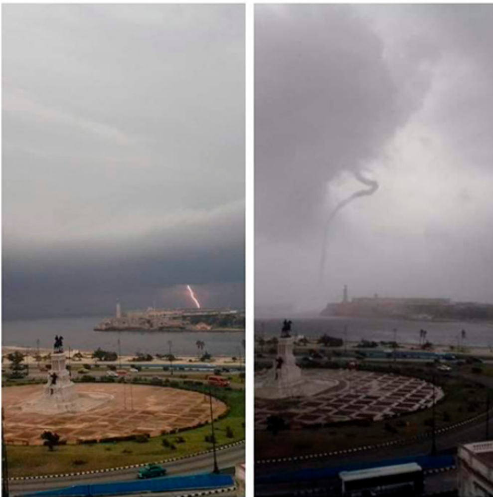
El fenómeno atmosférico coincide con la llegada del primer frente frío.

La Habana, 19 oct (RHC) El Instituto de Meteorología de Cuba (Insmet) confirmó este miércoles la ocurrencia, en horas de la mañana, de una tromba marina próxima al castillo de los Tres Reyes del Morro, en La Habana.