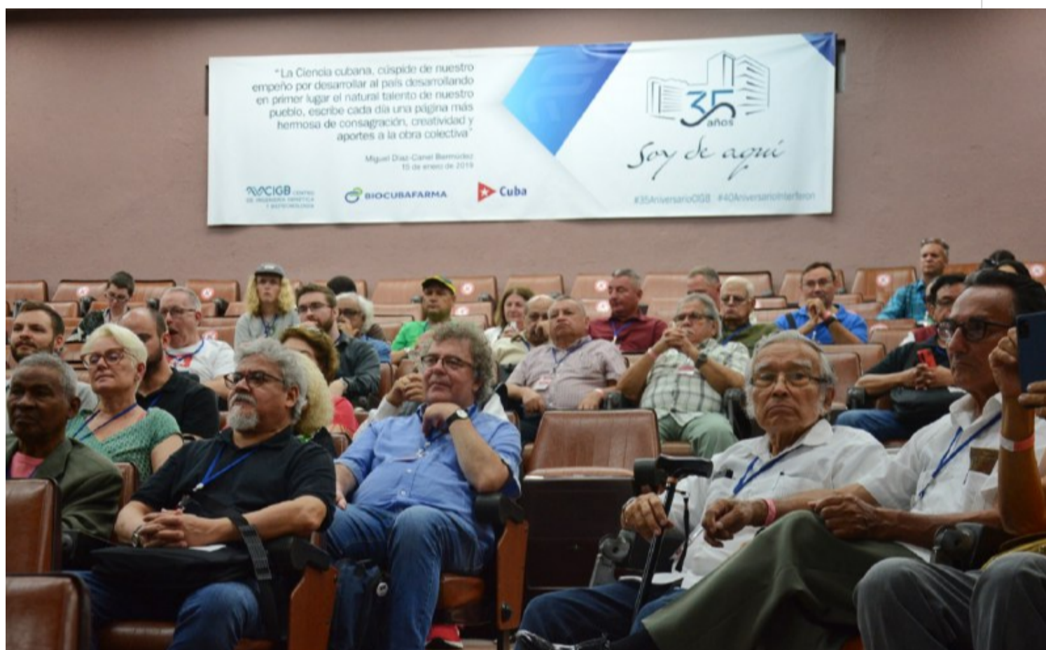
Participantes en el XXII Encuentro Internacional de Partidos Comunistas y Obreros visita el CIGB.

La Habana, 26 (RHC) Una delegación que participa en el XXII Encuentro Internacional de Partidos Comunistas y Obreros (EIPCO), con sede en esta capital, intercambió este jueves con científicos del Centro de Ingeniería Genética y Biotecnología (CIGB).