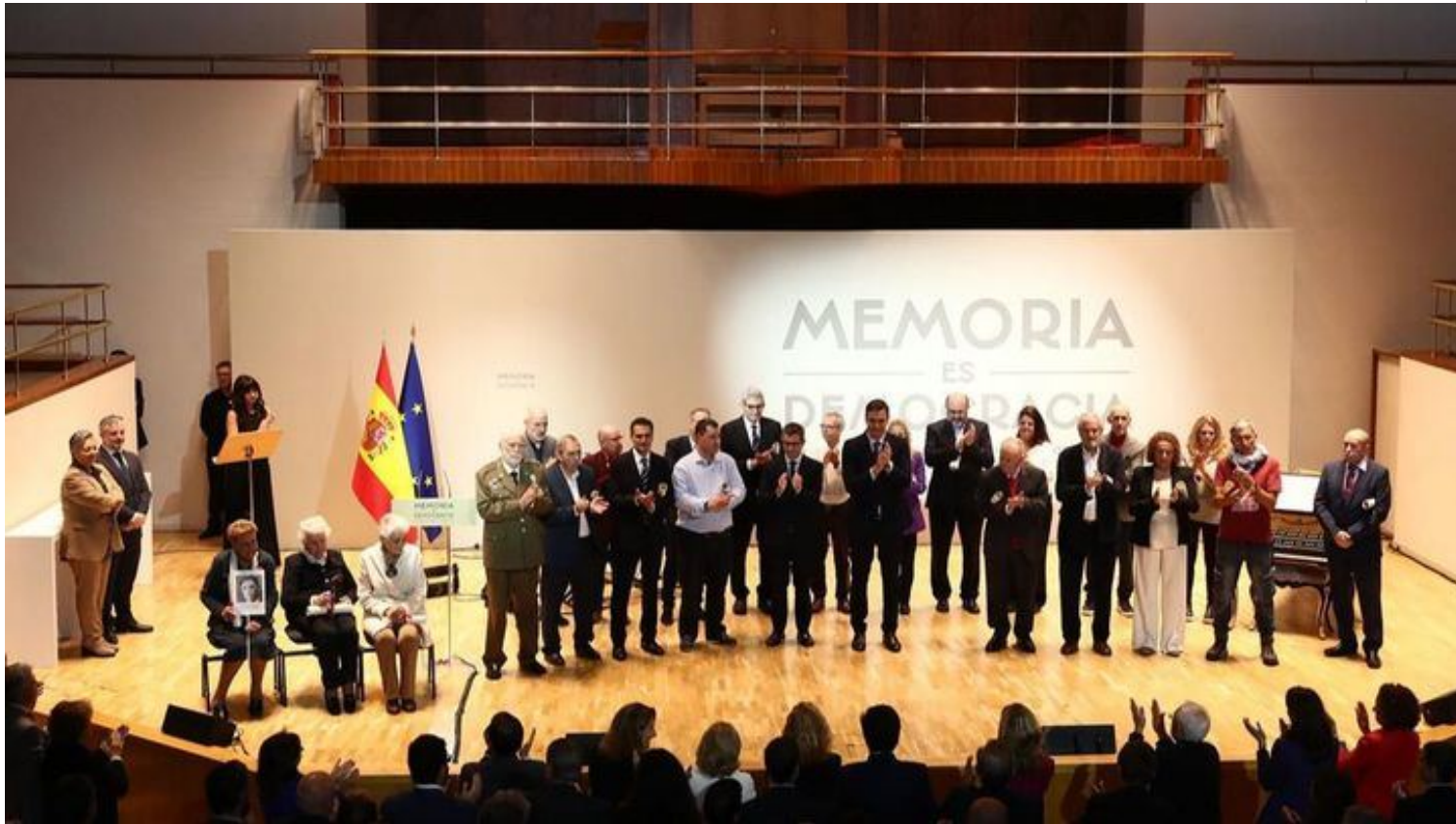
Homenaje a las víctimas del golpe militar, la Guerra Civil y la dictadura franquista.

Madrid, 31 oct (RHC) El Gobierno de España encabezó -este lunes- un homenaje a las víctimas del golpe militar, la Guerra Civil y la dictadura franquista, con el tema del conflicto judicial en el ambiente.