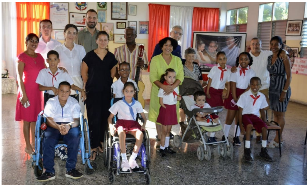
Los visitantes en la escuela 'Solidaridad con Panamá'.

La Habana, 1 nov (RHC) El diputado del Parlamento Europeo, Massimiliano Smeriglio recorrió este martes varios sitios de interés de La Habana, y se reunió con autoridades del Gobierno en la provincia como parte de la agenda de trabajo de su visita oficial a Cuba.