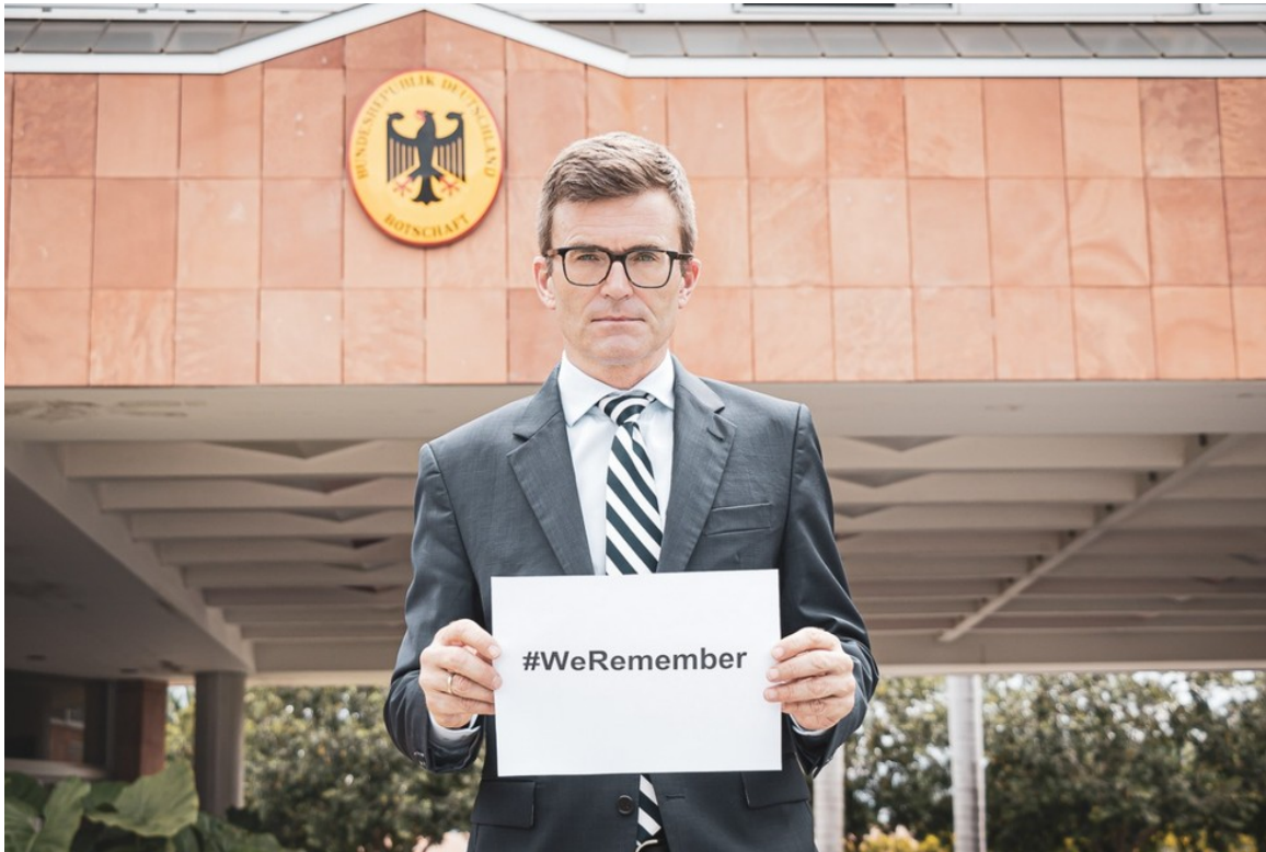
Embajador de Alemania en Brasil, Heiko Thoms.

Por el momento, el Ministerio Público de Santa Catarina abrió una investigación y alega que no hubo intención de apología al nazismo durante el acto frente al 14 Regimiento de Caballería Mecanizado, base del Ejército en la ciudad de San Miguel do Oeste.