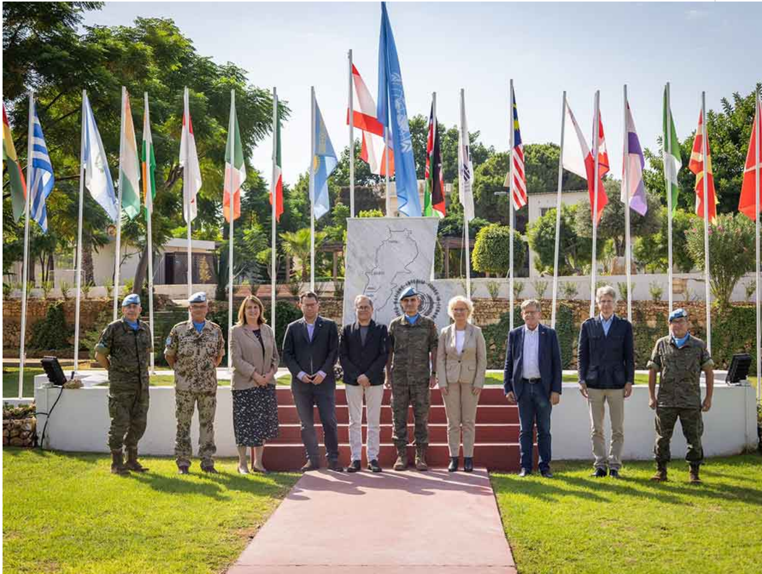
La ministra de Defensa germana, Christine Lambrecht asegura ayuda a la armada libanesa.

Beirut, 6 nov (RHC) Alemania brindará apoyo al Ejército de Líbano en las áreas de monitoreo y entrenamiento en el campo marítimo, trascendió este domingo en el contexto de la visita de la ministra de Defensa germana, Christine Lambrecht.