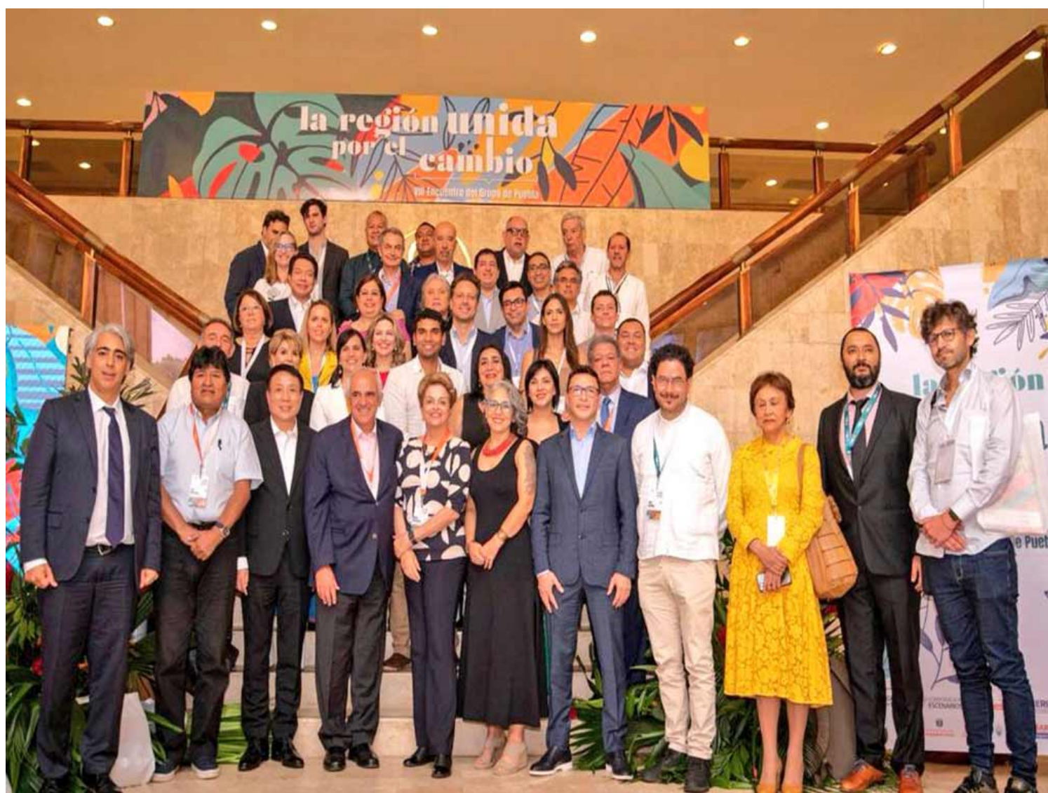
VIII Encuentro del Grupo de Puebla: "La región unida por el cambio".