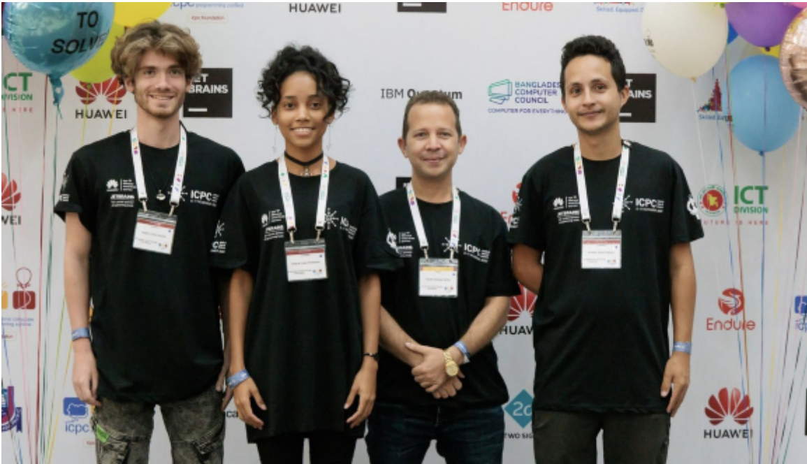
Equipo FreesTyle, de la Universidad de las Ciencias Informáticas (UCI).

La final mundial del ICPC fue organizada por el Gobierno de Bangladés y auspiciada por la University of Asia Pacific (UAP).