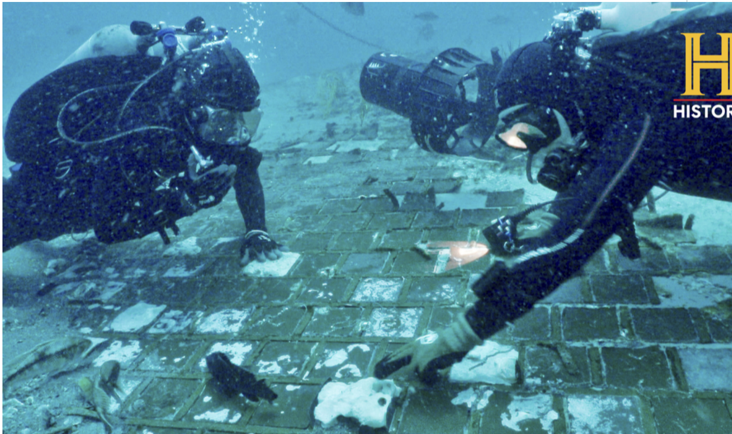
Equipo de History Channel inspecciona el fragmento del Challenger.

El fragmento mide alrededor de 4,5 por 4,5 metros, pero sus dimensiones podrían ser mayores, ya que en parte sigue cubierto de arena. En todo caso, se trata de una de las piezas más grandes de Challenger descubiertas hasta el momento, ya que en 1996 fueron encontrados dos fragmentos del ala izquierda.