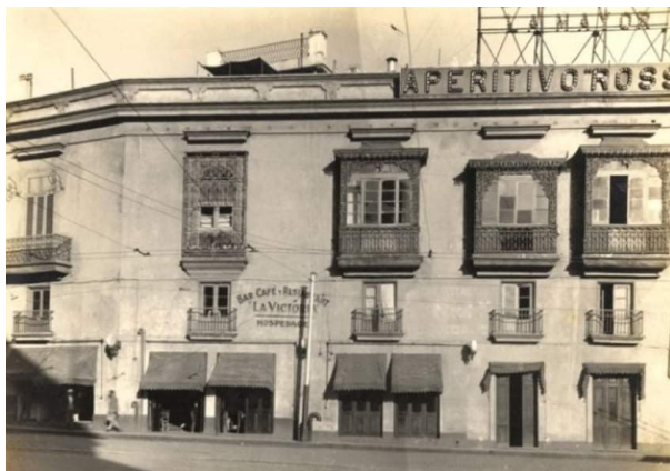
Antiguo Bar La Victoria