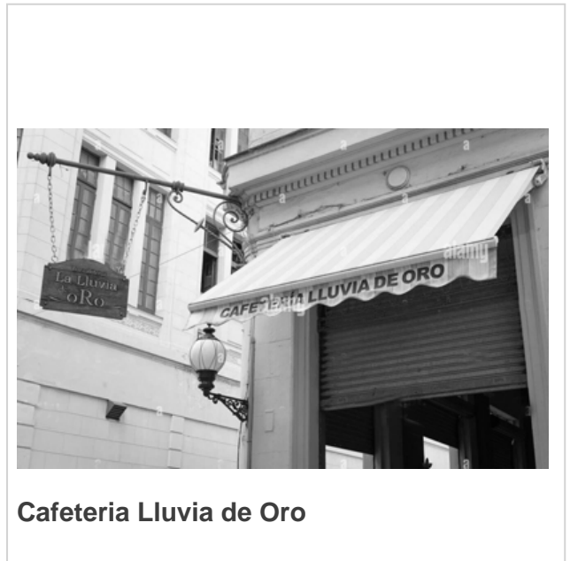
Cafeteria Lluvia de Oro

Eran los tiempos en que en las cartas de los restaurantes habaneros podía faltar cualquier plato menos la crema de queso, el fricasé de ternera y el cachelo con papas, insignia del Hotel Riviera. Hoy, en los jardines del Hotel Nacional se degusta un sándwich cubano de campeonato. Y muchos establecimientos no estatales abrieron sus puertas con buen café y sin escupideras. (Tomado de JR)