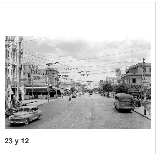
23 y 12

Secades, sentado a una mesa del café del Palacio de los Gritos, en Concordia y Lucena, escribía a mano sus crónicas insuperables. En Las Columnas, antigua Bodega de Alonso, se deleitó García Lorca con una champola de guanábana una tarde de abril de 1930. Rubén Darío, Blasco Ibáñez, Jacinto Benavente, Eduardo Zamacois, Luis Cardoza y Aragón y otras figuras extranjeras de las letras y el espectáculo visitaron