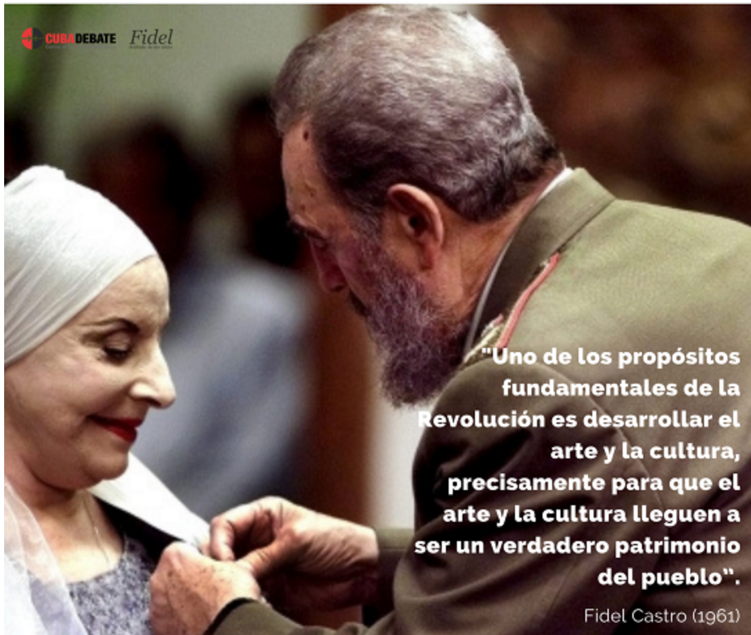
Alicia Alonso reçoit l'ordre "José Martí", la plus haute distinction décernée par le Conseil d'État cubain.

"L'un des objectifs fondamentaux de la Révolution est de développer l'art et la culture, précisément pour que l'art et la culture deviennent un véritable patrimoine du peuple".