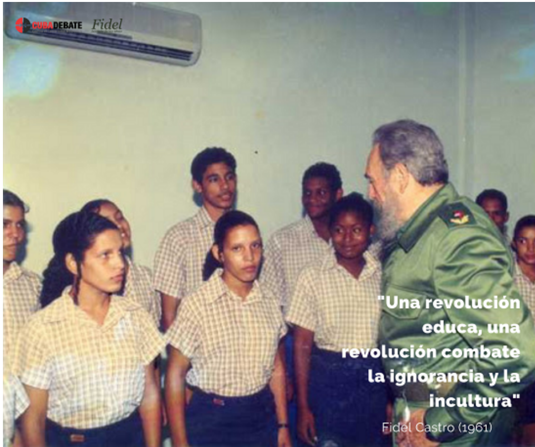
Fidel avec des étudiants de l'école des moniteurs d'art (EIA).

"Une révolution éduque, une révolution combat l'ignorance et l'ignorance, parce que l'ignorance et l'ignorance sont les piliers sur lesquels est construit tout l'édifice du mensonge, tout l'édifice de la misère, tout l'édifice de l'exploitation".