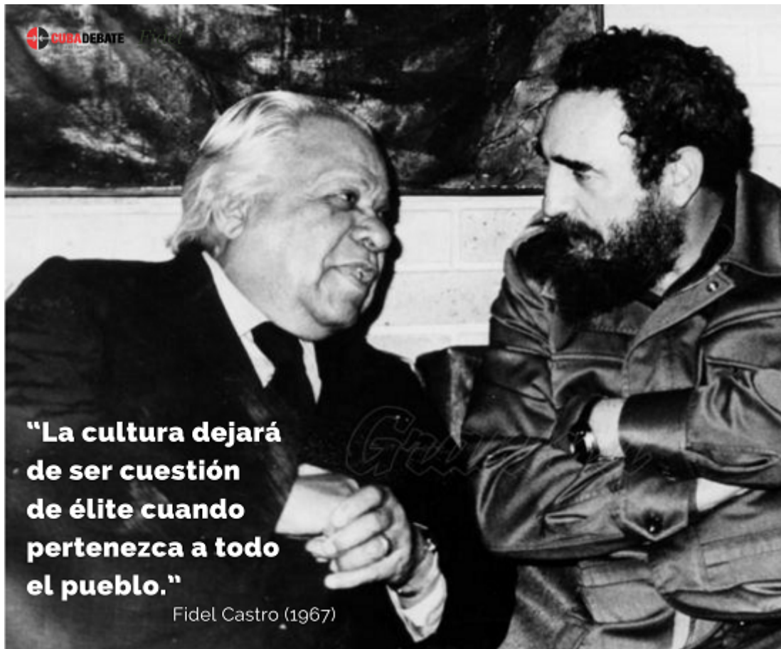
Fidel s'entretient avec le poète national, Nicolás Guillén.

Cubadebate et le site Fidel Soldado de las Ideas partagent avec vous quelques photos et phrases que le leader historique de la Révolution a dites sur la culture cubaine tout au long de la Révolution.