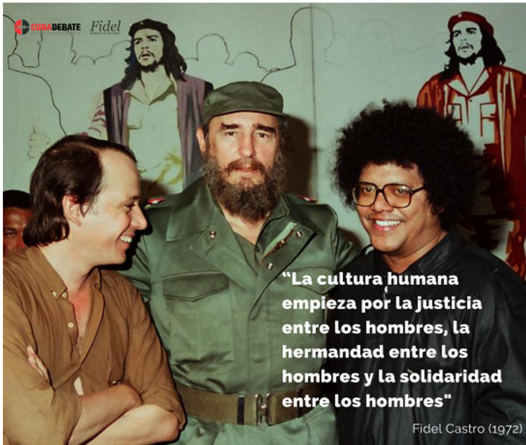
Avec Silvio Rodríguez et Pablo Milanés.

"La culture humaine commence par la justice entre les hommes, la fraternité entre les hommes, la solidarité entre les hommes. La culture commence par mettre l'homme au centre, l'objectif de l'effort. Et une société ne peut être dite cultivée si elle fait de l'homme un instrument, un objet".