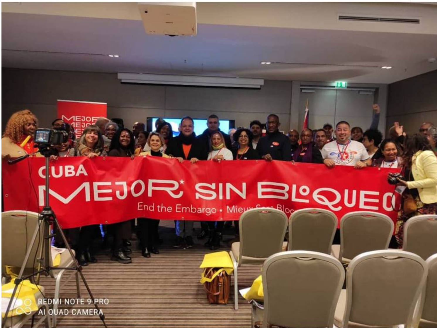
El ECRE de Berlín decidió retomar los encuentros presenciales.