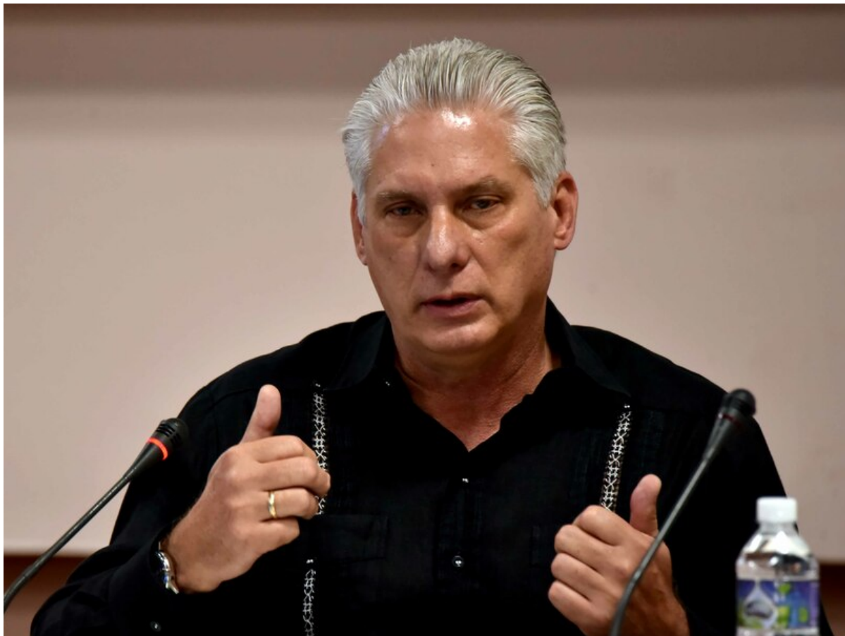
Díaz-Canel ratificó que el tema energético fue prioridad en su gira internacional.

La Habana, 29 nov (RHC) El primer secretario del Comité Central del Partido Comunista de Cuba y presidente de la República, Miguel Díaz-Canel ratificó este martes la prioridad que tuvo el tema energético en su recién finalizada gira internacional por naciones de África, Asia y Europa.