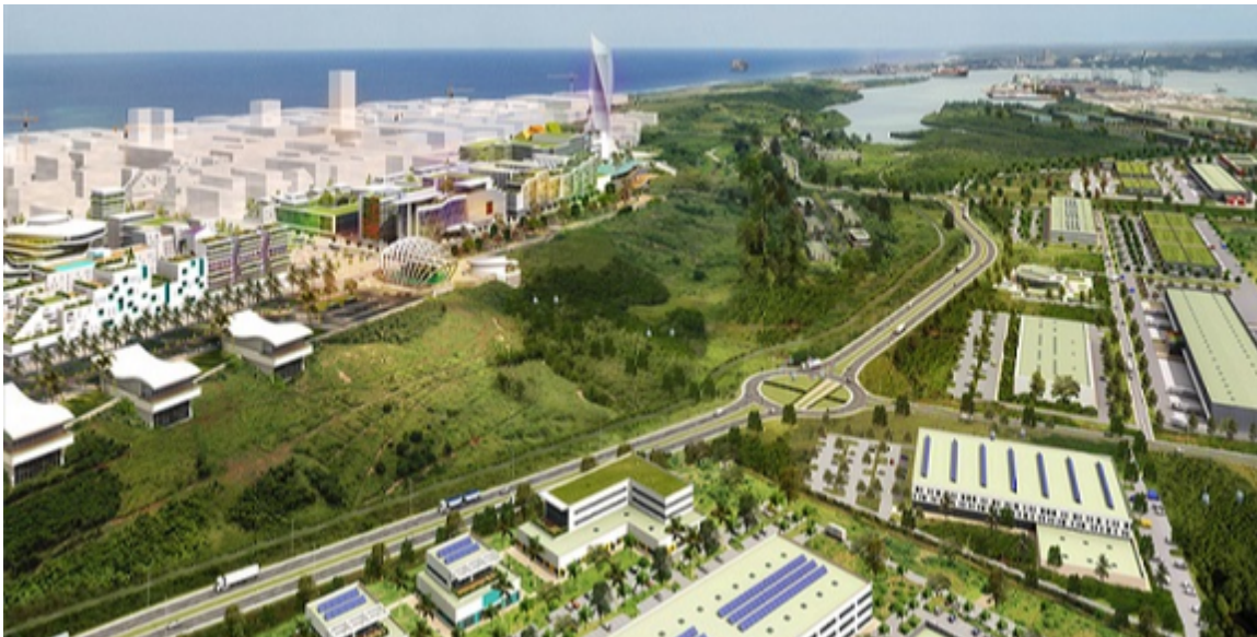
ZEDM, une enclave située à 45 km à l'ouest de La Havane.