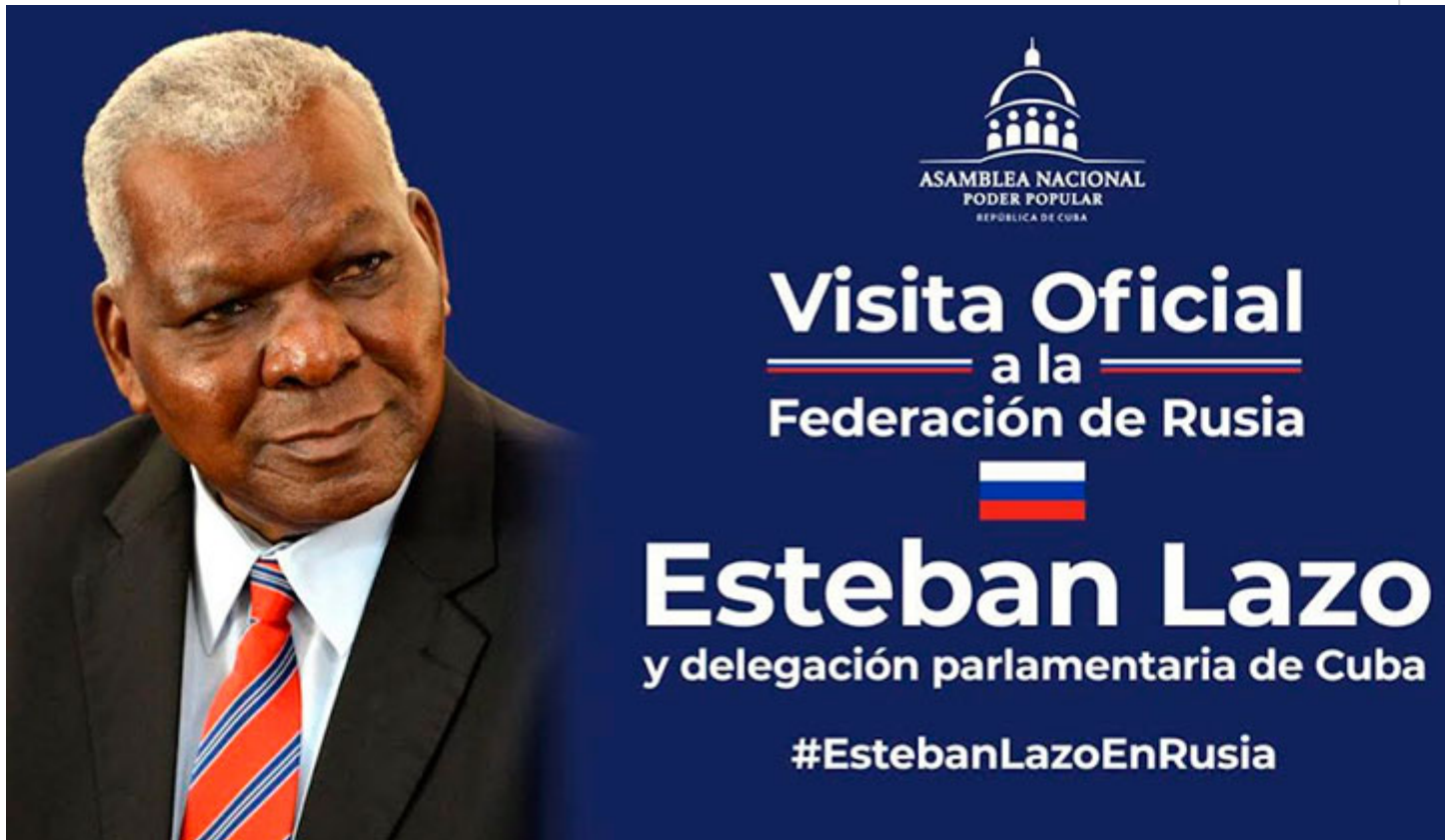
Esteban Lazo realiza visita oficial a Rusia

Moscú, 2 dic (RHC) Fructífera resultó también la segunda jornada de la visita oficial a la Federación de Rusia del miembro del Buró Político del Comité Central del Partido, Esteban Lazo Hernández, presidente de la Asamblea Nacional del Poder Popular y del Consejo de Estado.