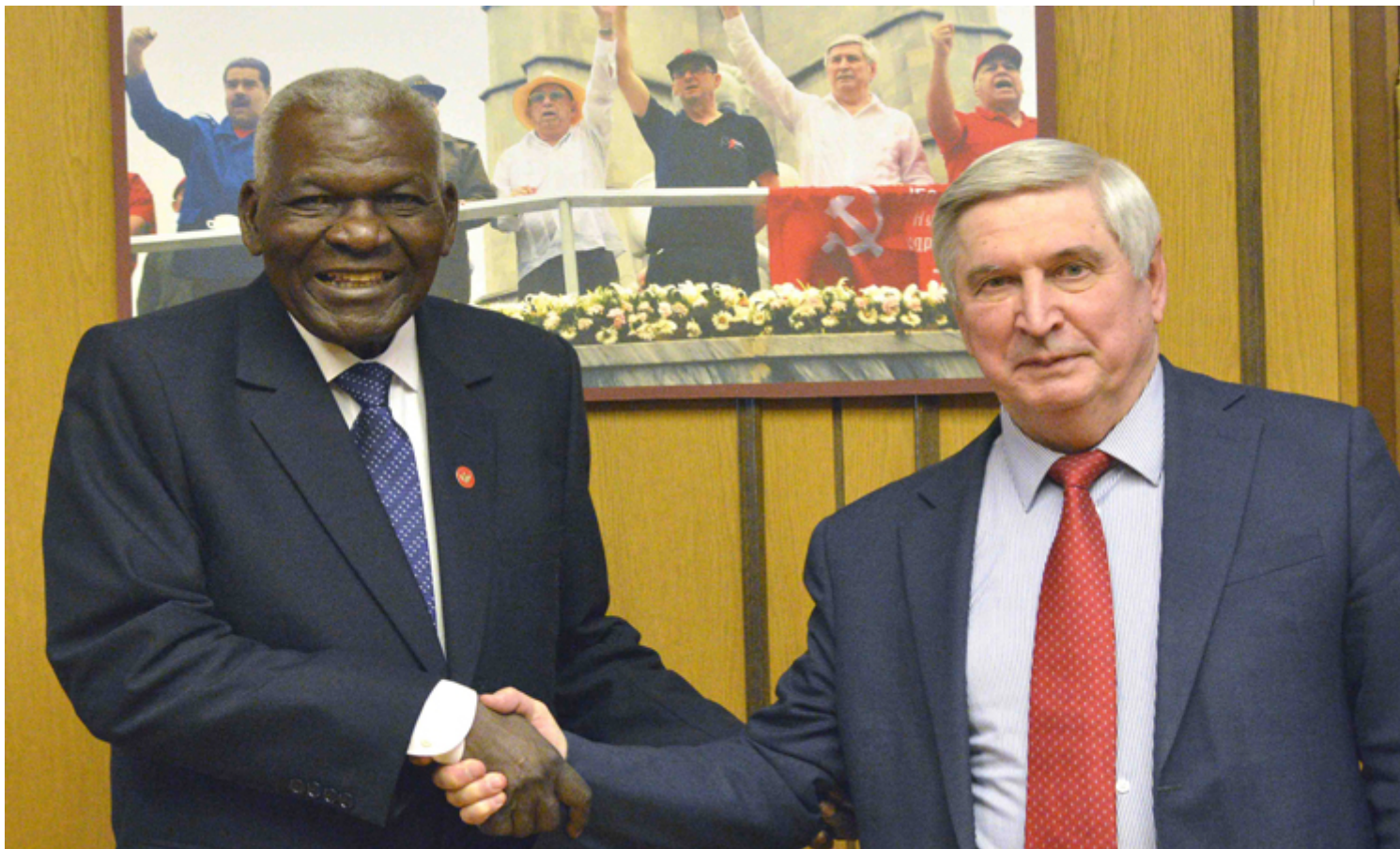
Esteban Lazo e Ivan Melnikov.

Temprano en la mañana de este 1ro. de diciembre, llegó nuevamente Esteban Lazo a la sede de la Duma Estatal de la Asamblea Federal de la Federación de Rusia; esta vez para sostener un entrañable encuentro con Ivan Melnikov, vicepresidente primero de este órgano legislativo y vicetitular del Partido Comunista de la Federación de Rusia.