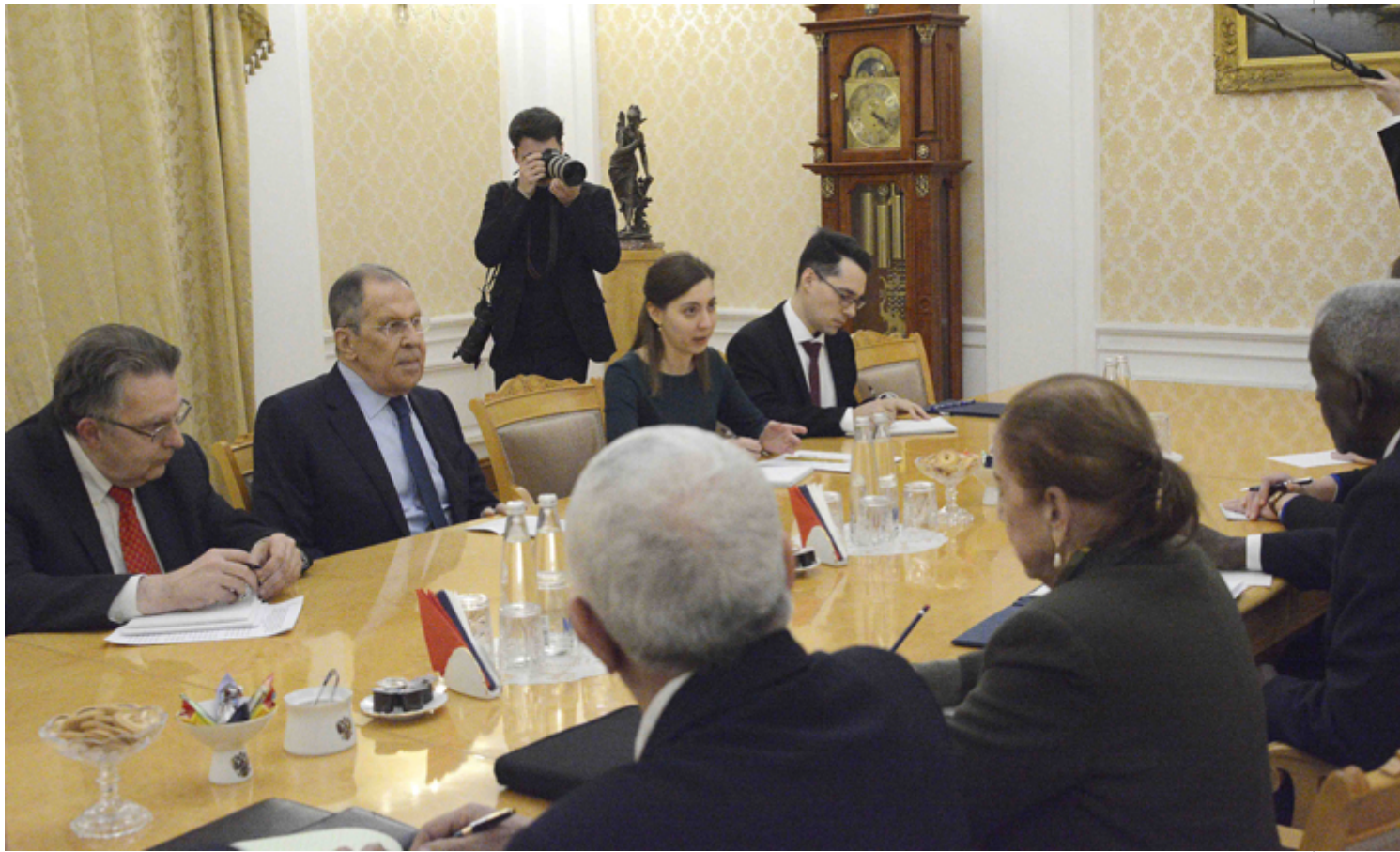
Esteban Lazo y Serguéi Lavrov.

Refirió la voluntad de ampliar y fortalecer las relaciones interparlamentarias. En este sentido, subrayó que con el Consejo de la Federación «coordinamos intereses y actividades futuras, mientras que con la Duma firmamos un convenio de colaboración, que establece la creación por ambas partes de comisiones encargadas de impulsar las relaciones bilaterales».