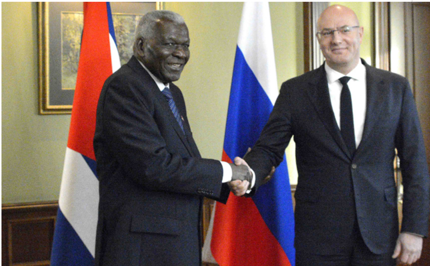
Esteban Lazo y Dmitry Chernyshenko.

Más tarde, Esteban Lazo dialogó con Dmitry Chernyshenko, vice primer ministro y copresidente de la Comisión Intergubernamental Ruso-Cubana. Ambas partes resaltaron las amplias potencialidades para continuar estrechando la colaboración económico-comercial y científico-técnica.