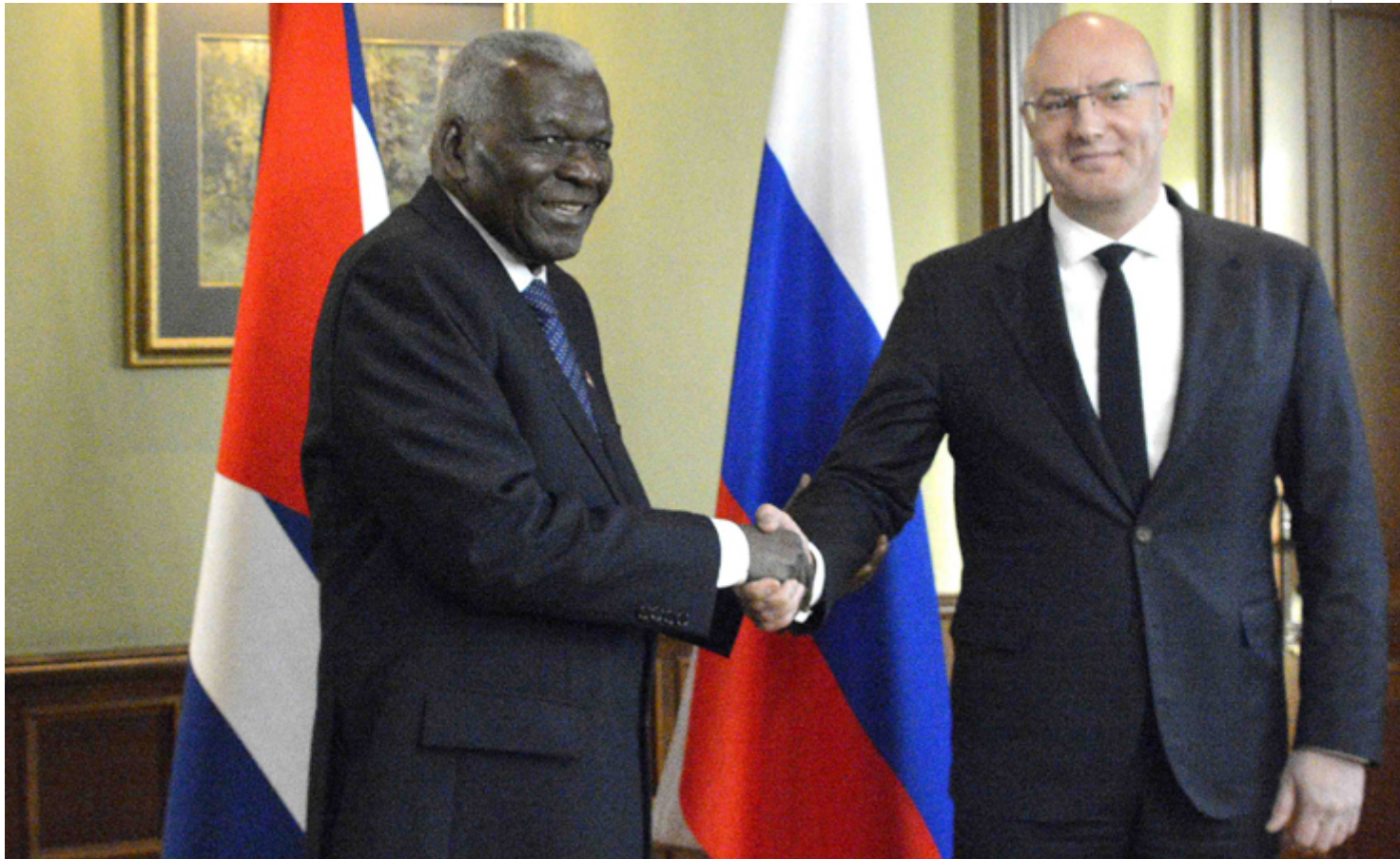
Esteban Lazo y Dmitry Chernyshenko.

Más tarde, Esteban Lazo dialogó con Dmitry Chernyshenko, vice primer ministro y copresidente de la Comisión Intergubernamental Ruso-Cubana. Ambas partes resaltaron las amplias potencialidades para continuar estrechando la colaboración económico-comercial y científico-técnica.