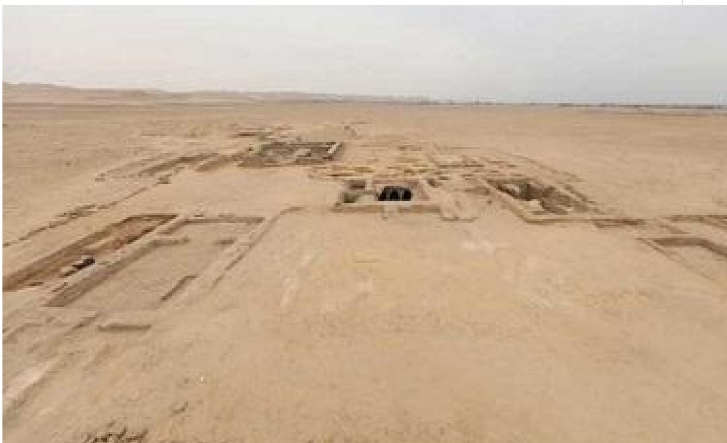
Egipto descubren retratos en vieja estructura funeraria

El Cairo, 3 dic (RHC) Arqueólogos egipcios descubrieron varios retratos al desenterrar una gran estructura funeraria de los periodos ptolemaico y romano en la gobernación de Fayum, ubicada al suroeste de esta capital, anunció hoy una fuente oficial.