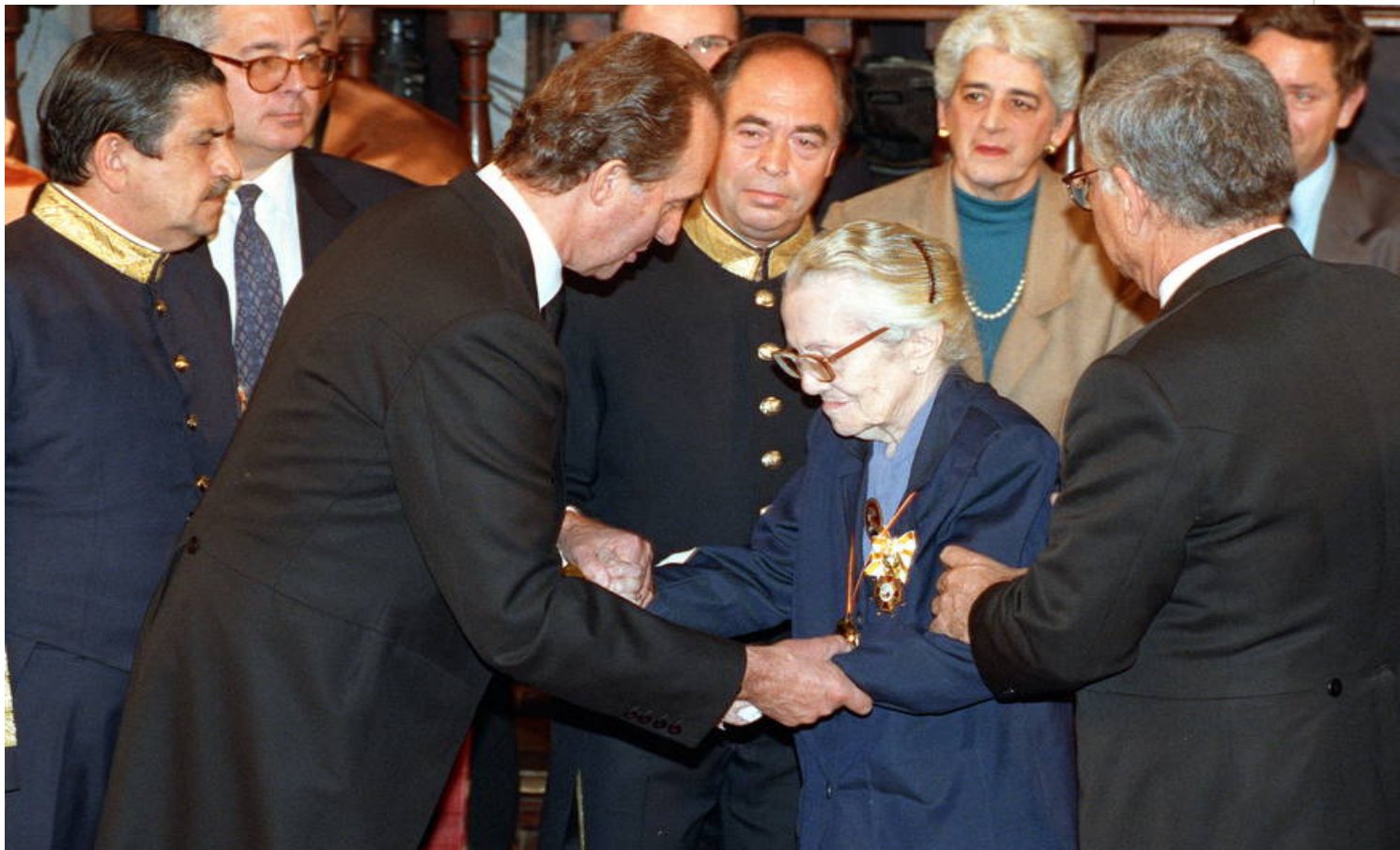
Premio Miguel de Cervantes

El 5 de noviembre de 1992 es merecedora del Premio Miguel de Cervantes. Al año siguiente viaja España. Allí de manos del Rey recibe el premio otorgado. Hace 30 años.