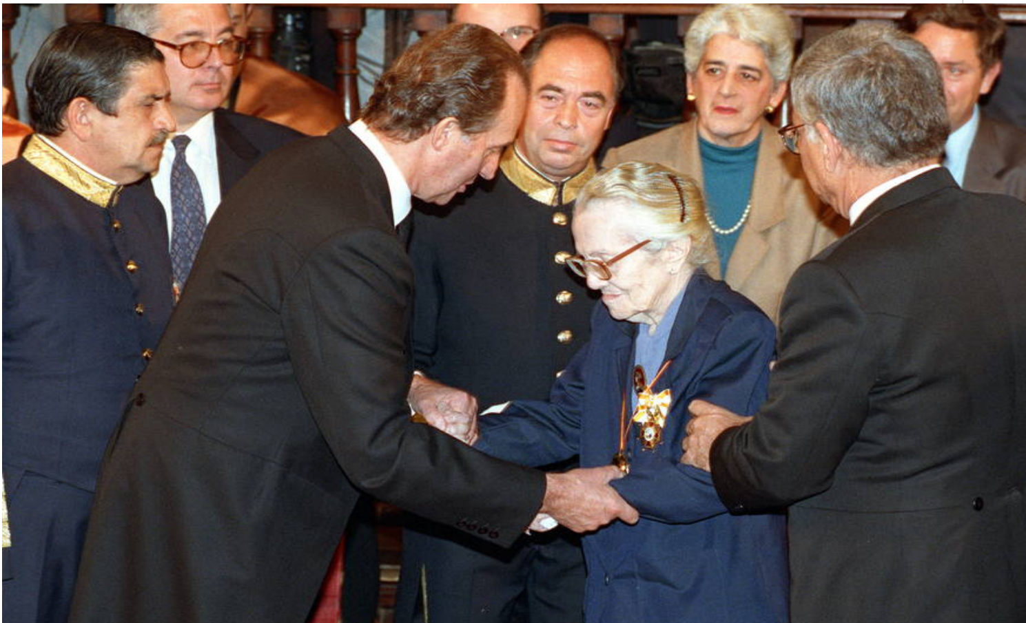
Premio Miguel de Cervantes

El 5 de noviembre de 1992 es merecedora del Premio Miguel de Cervantes. Al año siguiente viaja España. Allí de manos del Rey recibe el premio otorgado. Hace 30 años.