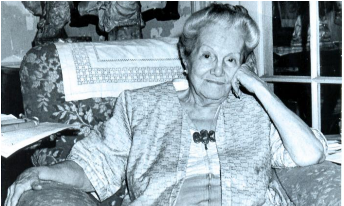
Dulce María Loynaz