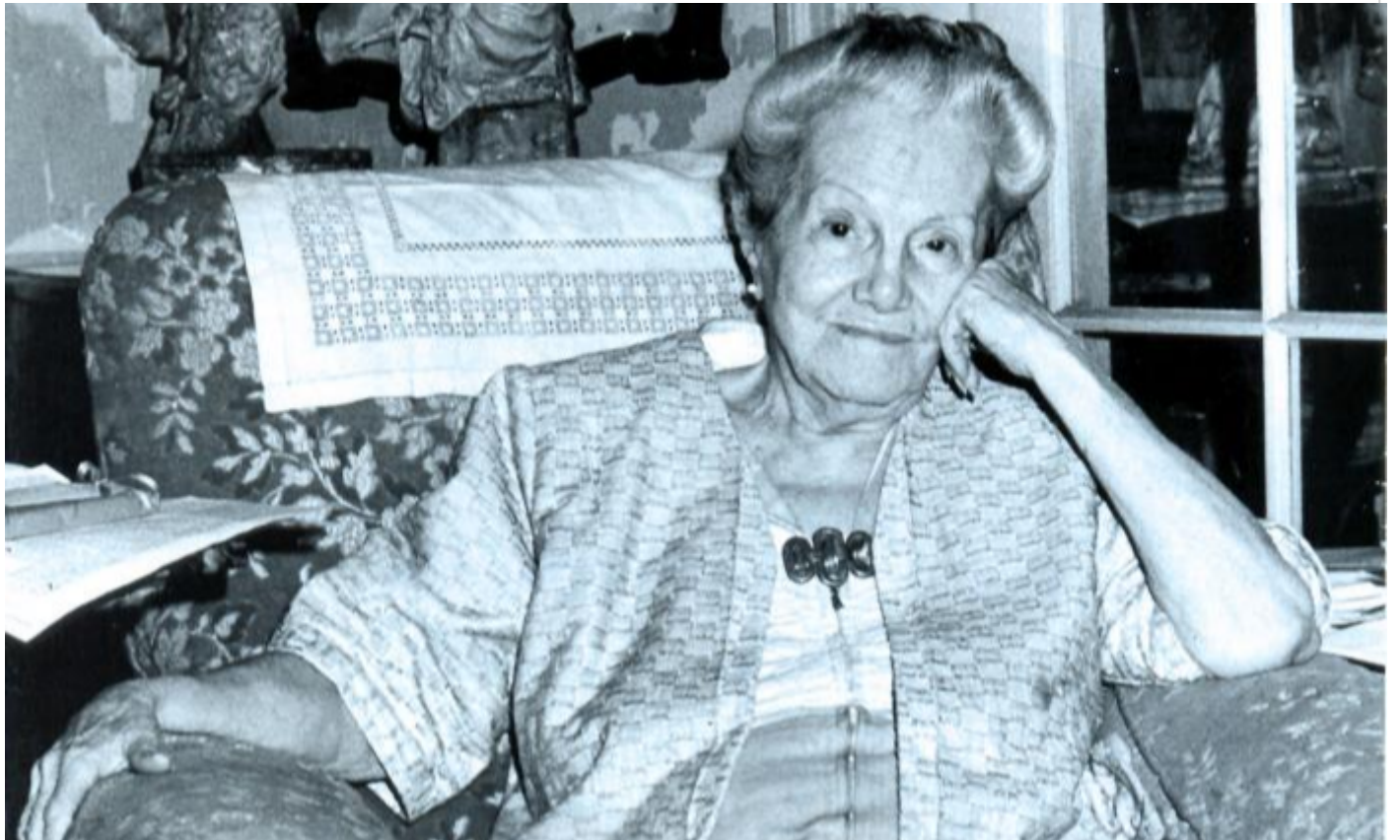
Dulce María Loynaz